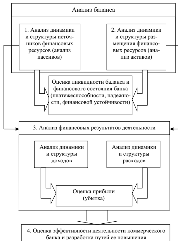
Рис. 2. Основные этапы финансового анализа деятельности коммерческого банка при комплексном подходе

Из изложенного можно сделать вывод, что наиболее приемлемым способом анализа финансовой деятельности банка является объединение второго и третьего подходов. Блок-схема такого способа анализа деятельности коммерческого банка показана на рис. 2.