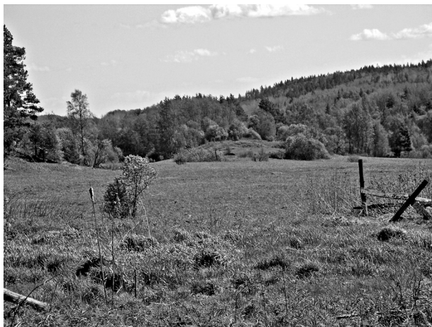
Рис. 3. Вид на холм Калмистомяки с северо-запада

Кладбище было обнаружено на наиболее возвышенной и одновременно относительно плоской северо-западной части холма Калмистомяки (рис. 3).