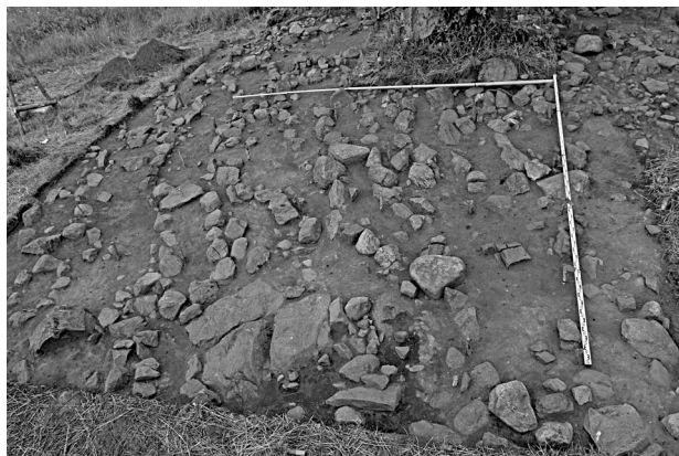
Рис. 5. Надмогильные сооружения из камня в центральной части могильника

Принципиально важным открытием в рассматриваемом могильнике стало обнаружение многочисленных (всего 55) надмогильных сооружений, представляющих собой вытянутые, овальные в плане оградки из крупных валунов в один ряд, расположенные по периметру могильной ямы (рис. 5).