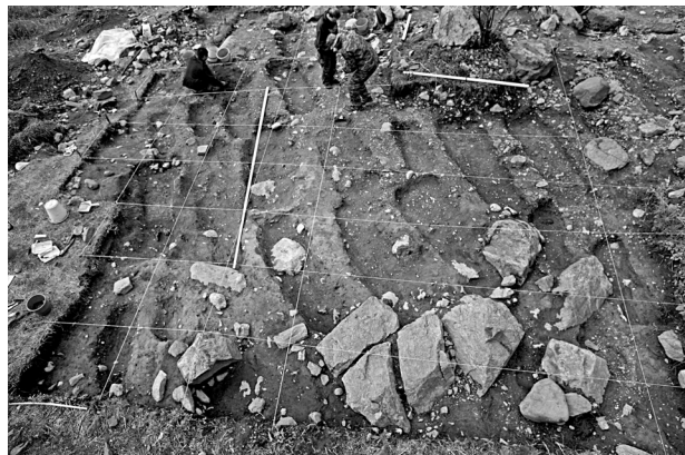
Рис. 4. Вид на площадь могильника после расчистки погребений (центральная часть, раскопки 2007 года)

жении двух столетий, а может быть, и позднее, оказались ненарушенными.