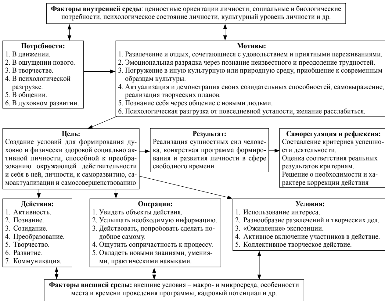
Рис. 1. Структура педагогической анимационной деятельности

2. Использование теоретических и практических знаний, умений и навыков, полученных в ходе изучения дисциплины «Основы анимационной деятельности», в процессе педагогической практики через вовлечение будущих педагогов в социокультурное воспитательное пространство школьного образовательного учреждения.