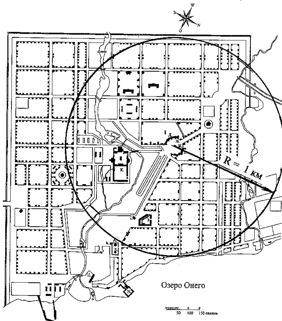
Рис. 3. Образцовый план г. Петрозаводска 1851 года