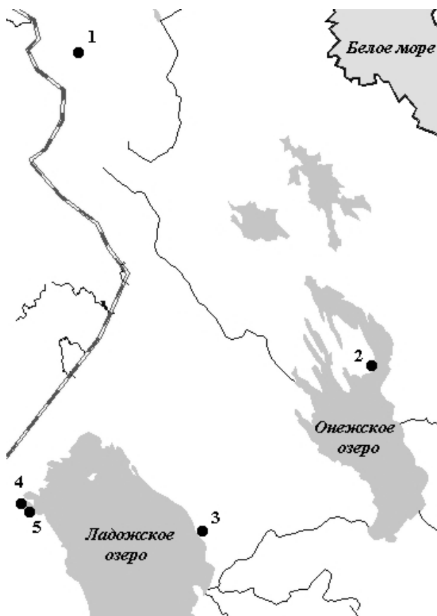
Рис. 1. Местонахождение каменных монументальных крестов на территории Республики Карелии:

Христианские древности не ограничивались крестами, высеченными из камня. Их дополняли широко распространенные на всем Русском Севере деревянные кресты, от которых к настоящему времени сохранились только основания – валунные кучи [33], [51].