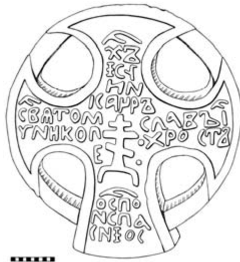
Рис. 4. Крест из д. Еройла (Олонецкий район Республики Карелии)

Крест, в традициях Русского Севера, раскрашен: лицевая сторона – в синий цвет, кант – пурпурный, торцы, включая внутреннюю часть средокрестия, – красные [48; 210]. Считается, что красный – это цвет Воскресения, синий – символ небесной сущности и бессмертия [26; 37, 107]. Возможно, это следы упоминаемого П. Минорским «обновления» в 1711 году.