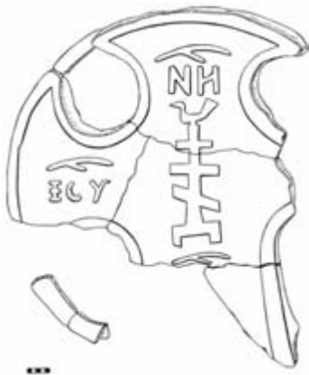
Рис. 2. Крест из могильника Кюлялахти Калмистомьяки (Лахденпохский район Республики Карелии)

Фрагменты круговых перемычек имеют следы от окрашивания в красноватый цвет. Использование при раскрашивании крестов различных оттенков красного цвета на общем желтом фоне соответствует православной традиции цветовой символики, применяемой от раннего Средневековья до «позднего» времени: «Крест раскрашен в обычные неяркие тона русской деревянной резьбы: ободок красноватый, главный крест желтоватый, под ним Голгофа – темно-оливковая, углубленные поля – тускло-голубые, исключая среднее поле на обороте креста, которое тускло-багровое» [9; 76]. Таким образом, можно утверждать, что в XIV веке при оформлении каменных крестов применялось их раскрашивание. Остается вопрос: производилось это в мастерской и было заключительной стадией при изготовлении изделия или раскраска осуществлялась на месте согласно вкусам заказчика?