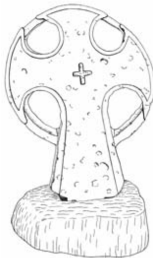
Рис. 3. Крест с о. Килпола (Лахденпохский район Республики Карелии)

По одной версии, дом, где нашли крест, находится на месте разрушенной деревенской часовни. Но более вероятно, что святыня была преднамеренно спрятана и закопана в период «воинствующего атеизма» в 20–30-е годы прошлого века. В обзоре культовых объектов, еще сохранившихся в конце 20-х годов XX века в Приладожье, Н. И. Репников отмечает наличие в д. Еройла «в двух часовнях по кресту, вписанному в круг, жальничного типа» [41; 22].