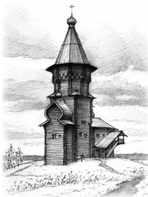
Рис. 2. Успенская церковь 1774 года в Кондопоге. Рисунок автора

Нельзя обойти вниманием Знаменскую церковь, изображенную на плане Тихвинского посада 1678 года. По-видимому, она имела три яруса и соответственно два фронтонных пояса [8; 120]. На плане города Олонца первой половины 1690-х годов можно увидеть церковь Николаевского погоста [8; 121]. В основании ее шатра изоб-