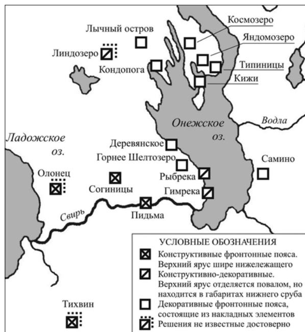
Рис. 4. Карта-схема распространения фронтонных поясов

Распространение фронтонных поясов, как мы видим на примерах достоверно известных построек, четко ограничивается Посвирьем и Обонежьем (рис. 4). Особенности распространения вариантов основных решений прослеживаются достаточно четко. Сужающиеся сверху ярусные структуры образуют конструктивные фронтонные пояса, имеющие функцию покрытия, а расширяющиеся, напротив, превращают их в декоративные элементы, только очертаниями напоминающие о своем первоначальном назначении. Сужающиеся сверху ярусные решения