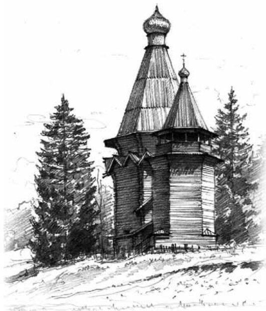
Рис. 3. Никольская церковь 1696 года в д. Согиницы. Рисунок автора

ражены два зигзага, в которых узнаются фронтонные пояса.