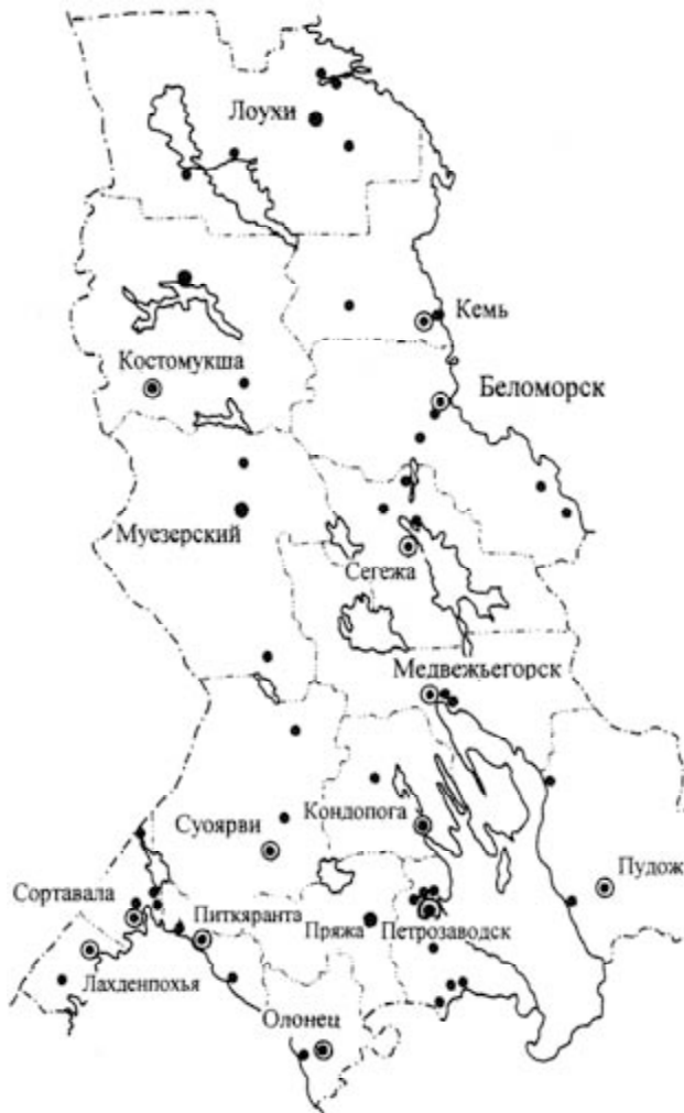
Рис. 9. Картограмма административно-территориального деления Республики Карелия на период во второй половине XX века

За период с 1939 по 1977 год оно увеличилось в 3,8 раза при росте всего населения республики только в 1,6 раза. В 1971 году численность городского населения в Карелии достигла полумиллионного рубежа, а к началу 1977 года составляла уже 566,7 тысячи человек. Примечательно, что рост городского населения в Карелии по своим темпам значительно опережал общероссийские показатели, что свидетельствует о высоком уровне индустриализации и урбанизации республики.