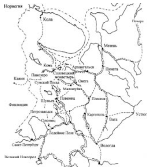
Рис. 6. Картограмма территории Российского Севера с основными торгово-транспортными путями в конце XIX – начале XX века

В 1897 году на территории Олонецкой губернии существовало только 7 городов – Петрозаводск, Олонец, Повенец, Пудож, Вытегра, Каргополь и Лодейное Поле. Это были небольшие провинциальные города, стягивавшие ничтожно малую часть населения Карелии. При средней по губернии доле городского населения, равной 7 %, в Олонецком, Лодейнополюском и Каргопольском уездах она составляла 3,1–3,7 %, в Пудожском и Повенецком – 4,3–4,9 %, в Вытегорском – 8 % и в Петрозаводском – 15,7 % (рис. 7) [47; 11].