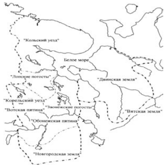
Рис. 5. Картограмма территории Российского Севера с границами административно-территориального деления в конце XV века

В силу специфики природно-климатических и ландшафтно-топографических условий Корельский уезд и Заонежские погосты (особенно южная их часть), а также южные уезды Двинской и Вятской земель имели наиболее благоприятные условия для сельского хозяйства. Земледелием занимались и население Лопских погостов, несмотря на их близость к полярному кругу, а Поморье, естественно, представляло собой промысловый район, где основными занятиями населения являлись морское и речное рыболовство, охота на морского зверя и выварка соли [7].