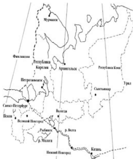
Рис. 1. Картограмма территории Российского Севера

Южной границей Российского Севера в исторической литературе принято считать линию, у которой в VIII веке остановилось массовое «стихийное» расселение славян и славяно-балтов (словене – в Приильменье, кривичи – на Верхней Волге), находившихся на поздней стадии развития первобытного общества. В VIII–IX веках эта линия совпадала с южной кромкой сплошной тайги, поскольку природная зональность в те времена была важным фактором, определявшим тип хозяйства, а через это отчасти и этнический состав населения. Она проходила от устья реки Невы (Санкт-Петербург) к месту слияния рек Мологи и Волги (между современными