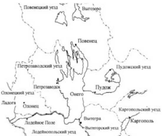
Рис. 7. Картограмма территорий Олонецкой и Архангельской губерний с границами административно-территориального деления в конце XIX – начале XX века