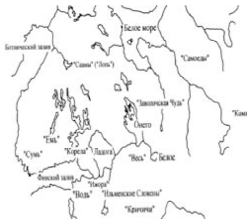
Рис. 3. Картограмма территории Российского Севера с зонами этнокультурного заселения в XI–XIII веках

В XI–XIII веках на территорию Российского Севера началось проникновение славян. Сначала это были переселенцы из Новгородской земли, а позднее – из Верхнего Поволжья (с территорий Ростово-Суздальского и Московского княжеств) (рис. 4) [6], [21], [45], [56]. В процессе своего движения на север русское население освоило территорию Ленинградской области (Посвирье), восточную часть Карелии (Заонежье и Карельское Поморье), Терский берег Мурманской и почти всю территорию Архангельской области (рис. 4, 5). К середине XII века территория, освоенная славянами, и земли веси, ижоры и корелы вошли в состав русского централизованного государства под управлением Новгорода [8; 22–37].