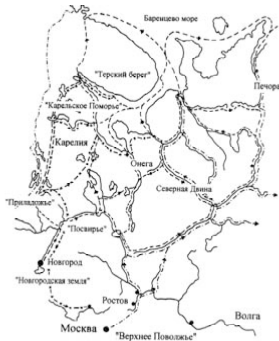
Рис. 4. Картограмма территории Российского Севера с путями движения славянских колонизационных потоков в XI–XV веках