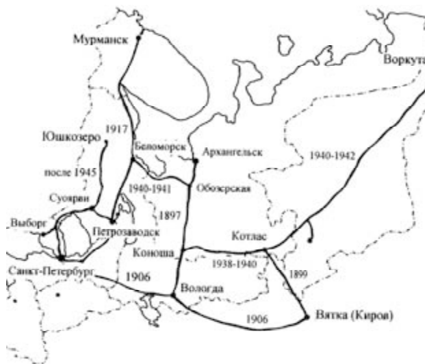
Рис. 8. Картограмма железных дорог на территории Российского Севера в начале – второй половине XX века

Для Республики Карелия, как и для многих других районов Российского Севера, в XX веке был характерен быстрый рост городского населения.