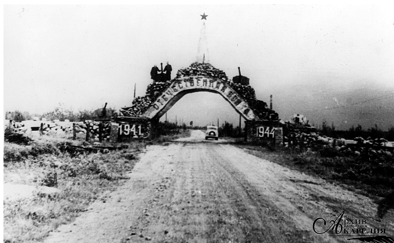
Фото 3. Дорога Лоухи – Тунгозеро – Ухта, 45-й км. 1954 год.

Монумент имел суровый, внушительный, устрашающий вид: его высота составляла 11,5 метра, а ширина в плане – 28,5 метра. Конструкция памятника представляла собой перекрывающую шоссе железобетонную арку, опирающуюся на две колонны. Верх арки был увенчан бетонированным шпилем, который завершался пятиконечной звездой, обработанной под золото. Крылья памятника имели вид двух ДОТов. В качестве элементов оформления военные использовали орудия и боеприпасы: пятидесятимиллиметровые пушки, пулеметы МГ-34, артиллерийские снаряды. Все стволы пушек и пулеметов обращались на запад, в сторону противника. Западная арка украшала крупная надпись «Отечественная война», выполненная из железобетонных букв высотой 50 сантиметров. На колонны были нанесены даты – 1941 и 1944, а также были прикреплены мемориальные доски, выкрашенные в красный цвет. Примечательно, что текст всех надписей на них был выполнен по указанию командира воинской части, которая занималась возведением монумента. На восточном фасаде арки в центре был помещен барельеф ордена «Отечественная война». Несмотря на то что работы по строительству памятника проводились силами военного подразделения из подручных средств в зимних условиях, качество работы было признано хорошим. Комиссия, принимавшая объект, признала памятник обороны Кестеньгского направления монументом, имеющим государственное значение. Более того, было вынесено решение о необходимости содержания его под охраной в соответствии с законодательством СССР 8 (фото 3).