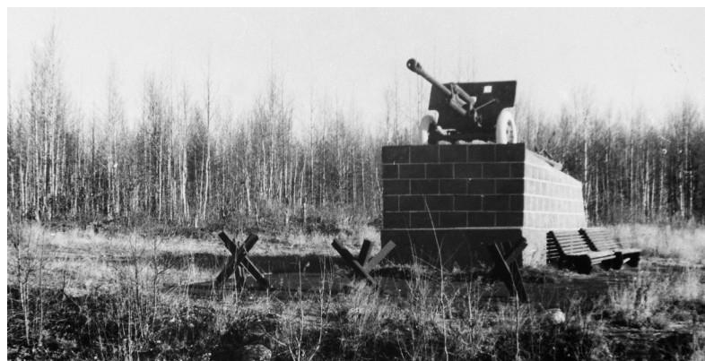
Фото 5. Памятник на рубеже обороны, где было остановлено наступление захватчиков в 1941 году, 44-й километр трассы Лоухи – Кестеньга. 1970-е годы