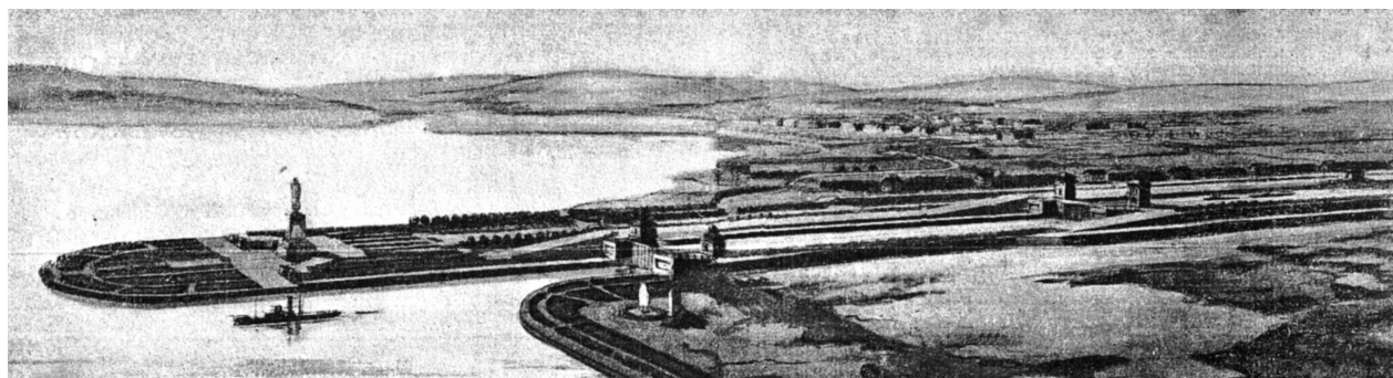
Фото 1. Перспектива первого шлюза Беломорско-Балтийского канала. Гидропроект ГУЛПС. Автор проекта – А. Я. Яковлев. Архитектура и строительство. 1946. № 21–22. С. 17

исторической победы над фашистской Германией» 6 . Центром композиции должен был стать восемнадцатиметровый памятник И. В. Сталину, который предполагалось установить на первом шлюзе при входе в канал из Онежского озера. Пространственную перспективу для его восприятия должна была создать аллея с цветниками и клумбами, ведущая от поселка к монументу. Так создавалась видимость доступности прототипа скульптуры для обычных граждан (фото 1).