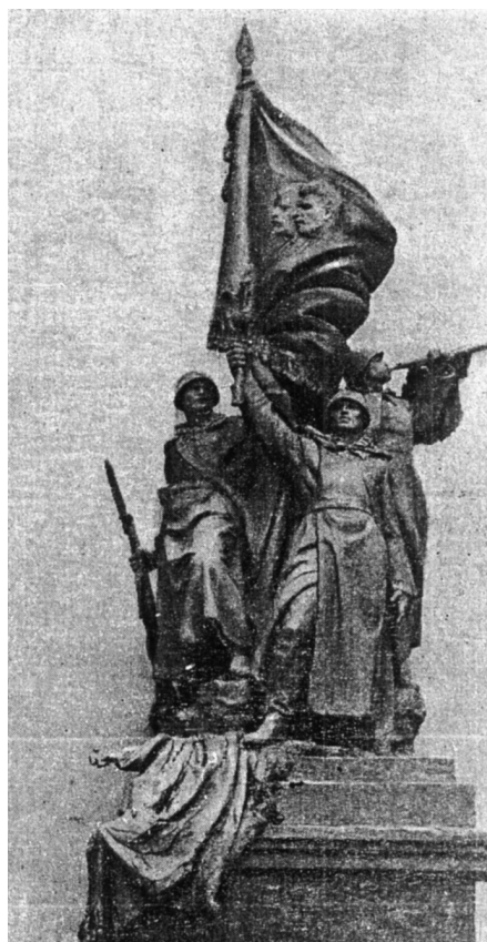
Фото 2. Проект памятника Победы, изображающий бойцов Советской армии, попирающих фашистское знамя, запланированный на Третьем шлюзе Беломорско-Балтийского канала. Скульптор – Н. В. Томский, архитектор – А. Я. Ковалев. Архитектура и строительство. 1946. № 21–22. С. 17

При обсуждении проекта члены архитектурного совета высказали ряд замечаний, среди них и те, в которых критиковались архитектурные сооружения. Например, некоторые члены совета не поддерживали неординарное решение авторов установить памятник Победы асимметрично, что нарушало бы строгую геометрию остального сооружения и делало монумент «случайным». Стела также вызвала ряд замечаний: верхушка и основание ее были «неуравновешенны», поэтому эти части проекта необходимо было доработать. Зато предлагалось установить мемориальную доску при входе в канал, чтобы еще раз подчеркнуть значимость и без того огромного монумента И. В. Сталина и завершить таким образом облик сооружения.