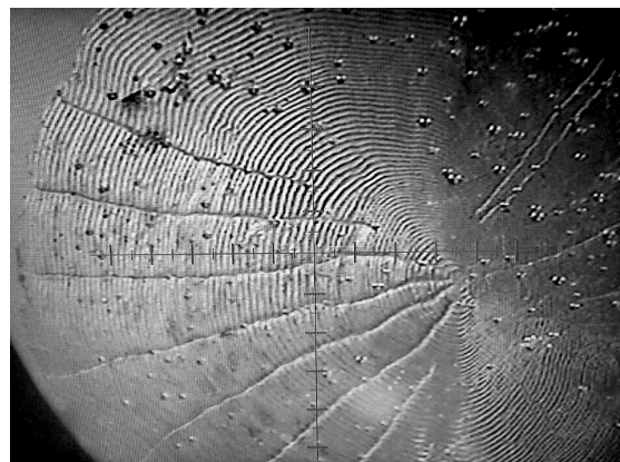
Рис. 3. Чешуя пойманной в прибрежной зоне Черного моря особи рыбец (возраст 3+)

Жабры имели нормальное окрашивание. Внутренности обследованной рыбы были залиты жиром. Их визуальный осмотр позволил оценить степень их ожирения по общепринятой шкале [17] в 4 балла из 5 возможных.