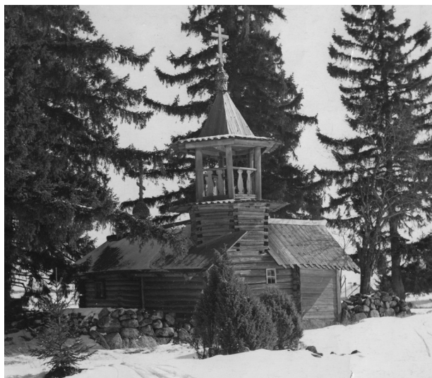
Рис. 1. Часовня в деревне Подъельники. 1970-е годы

ня была одночастной. Пристройка колокольни и сеней, по его мнению, относится ко второй половине XIX века [1; 180]. По данным научного паспорта памятника, часовня была срублена в конце XVIII века, а время устройства колокольни относится к середине XIX века. В паспорте ничего не говорится о времени устройства сеней, но указывается, что обшивка главков железом и изменения в интерьере могли произойти в конце XIX века [5].