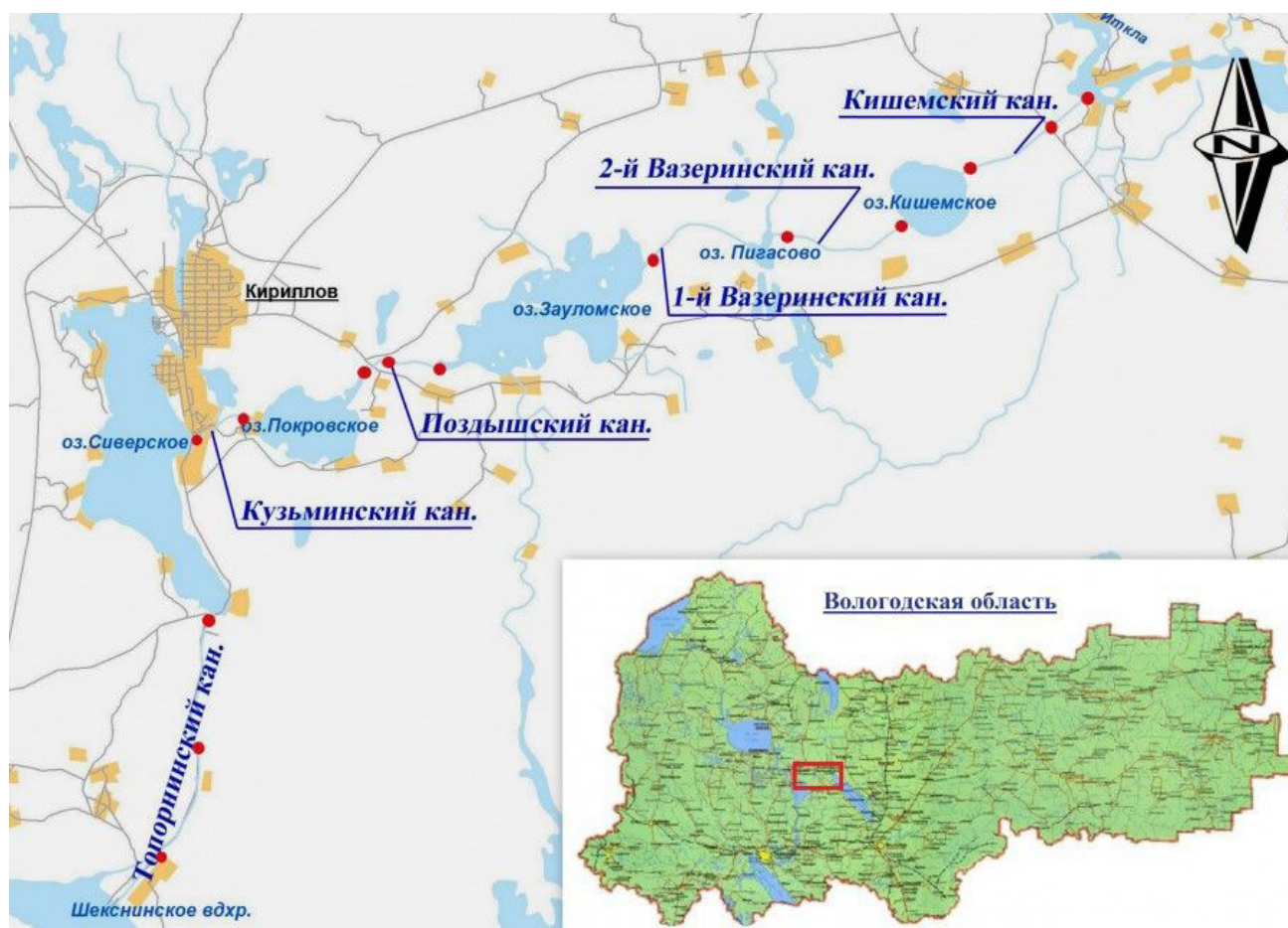
Рис. 1. Картосхема Северо-Двинской шлюзованной системы (красным пуансоном обозначены места отбора гидробиологических проб)

Исследования проводились на 6 каналах Северо-Двинской шлюзованной системы в июле 2010 г. Северо-Двинская водная система располагается в центральной части Вологодской области на территории Национального парка «Русский Север» (рис. 1). Построенная в 1825–1828 гг., она соединяет реки Шексна и Сухона, тем самым связывая бассейны рек Волги и Северной Двины. По своему экономическому значению Северо-Двинская система значительно уступает Волго-Балтийской. В последнее время увеличивается ее значение как туристического маршрута.