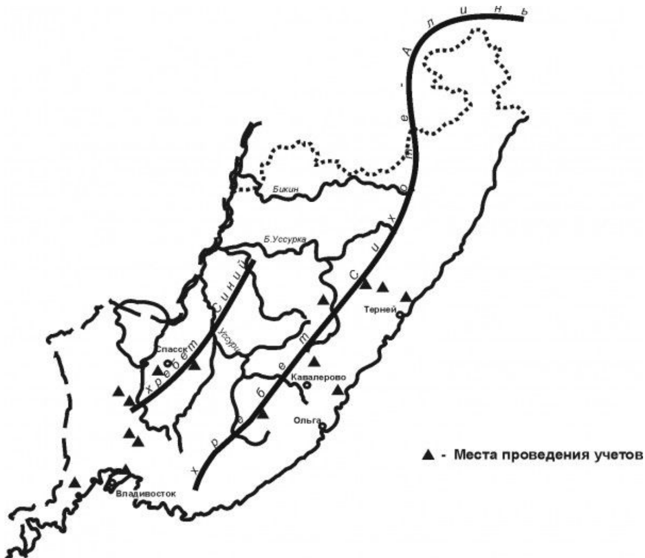
Рис. 1. Места сбора материалов Fig. 1. Places of material collection

ские особенности учетов и индивидуальные склонности исследователей нередко уменьшают сопоставимость данных. В дальнейшем использованы данные упомянутых во Введении исследователей, наиболее полно отражающие количественные характеристики населения и оригинальные материалы автора, собранные в 1976–1982 гг. в окрестностях Владивостока, в Уссурийском заповеднике и Михайловском районе края.