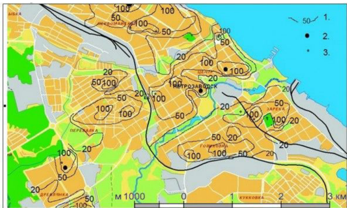
Рис. 2. Схематическая карта значений магнитной индукции в пределах территории г. Петрозаводска. Условные обозначения: 1. Изолинии и их оцифровка, нТл. 2. Аномалии по 3δ пределу. 3. Аномалии по 2δ пределу

Как видно из рис. 2, в пределах изученной территории преобладающими являются значения магнитной индукции 50–100 нТл, а местами и выше 100 нТл. Минимальные значения, до 20 нТл, четко приурочены к рекреационным и зеленым зонам, кладбищам и другим участкам с относительно невысо-