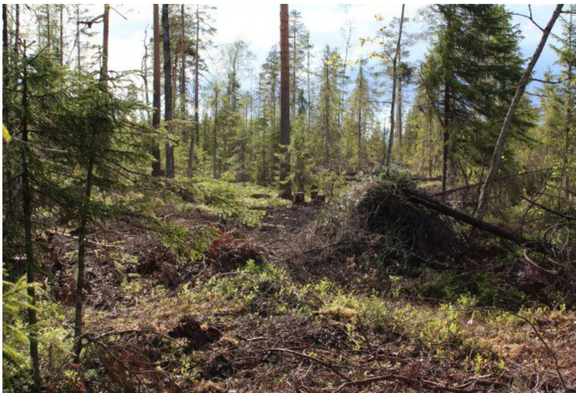
Рис. 5. Сплошная рубка с сохранением элементов исходного древостоя Fig. 5. Clear-cutting with preservation of original elements of the stand

перехода от сплошных рубок к несплошным и широкого внедрения различных методов сохранения мозаичности лесного ландшафта при сплошных рубках недостаточно внесения конкретных изменений в отдельные нормативные правовые акты (например, ограничить площадь деланки сплошной рубки до 10 га). Необходимы изменения, обеспечивающие устойчивое лесопользование в целом, частью которых будут изменения, касающиеся применения различных видов рубок и особенностей их проведения.