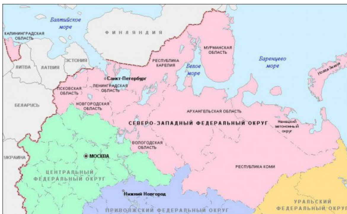
Рис. 1. Карта-схема Северо-Западного федерального округа РФ (Северо-Западный..., 2016а) Fig. 1. Schematic map of the North-West Federal District of Russia (North-West..., 2016a)

Лесопромышленный сектор является одним из ключевых в экономике региона. На территории СЗФО произрастает почти 60 % лесов европейской части России. Запас древесины – около 10 млрд м 3 . Здесь производится 30 % российских пиломатериалов, 40 % клееной фанеры, порядка 40 % деловой древесины, 50 % картона и 60 % бумаги (Северо-Западный..., 2016б).