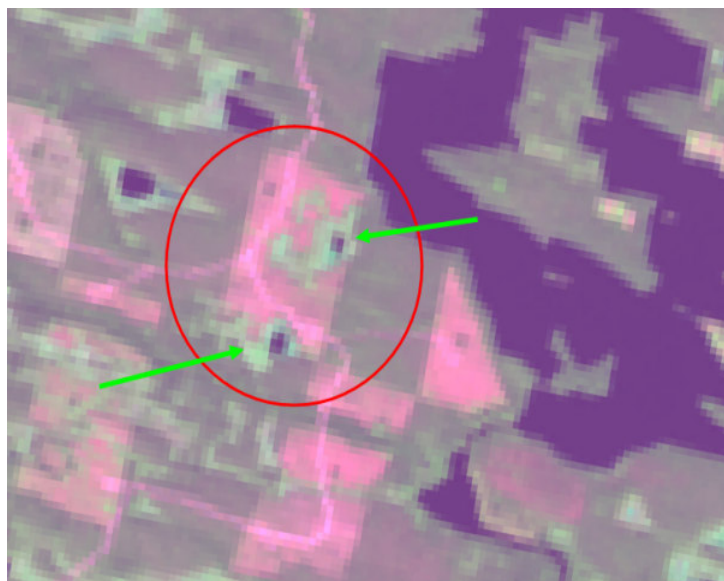
Рис. 3. Космический снимок делянки сплошной рубки с сохраненными ключевыми биотопами (указаны на снимке стрелками; снимок спутника Landsat, http://glovis.usgs.gov/ )

Fig. 3. Satellite image of clear-cut plot with protected key habitats (indicated by arrows in the picture; picture of Landsat satellite, http://glovis.usgs.gov/ )