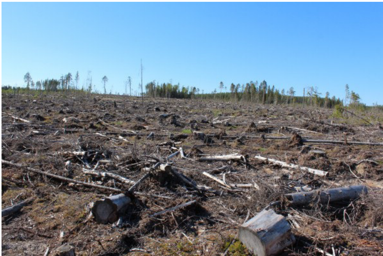
Рис. 4. Сплошная рубка большой площади без сохранения ключевых биотопов Fig. 4. Large clear-cut plot without preserving key habitats

Если проведение несплошных рубок невозможно, то рубки следует планировать так, чтобы после заготовки древесины лесопользователи оставили за собой территорию с как можно менее преобразованной лесной средой, способной наилучшим образом восстановиться естественным образом (рис. 5). Для этого необходимо принимать специальные меры по сохранению лесной среды и мозаичности лесного ландшафта. Надо стараться сохранить как можно больше элементов исходного леса, которые позволят уменьшить степень изменения лесной среды и степень нарушения почвенного покрова (поскольку каждое оставленное на корню дерево уменьшает количество проходов техники и ее нагрузку на почву). Для таких условий вполне подходящим компромиссом были бы условно-сплошные рубки.