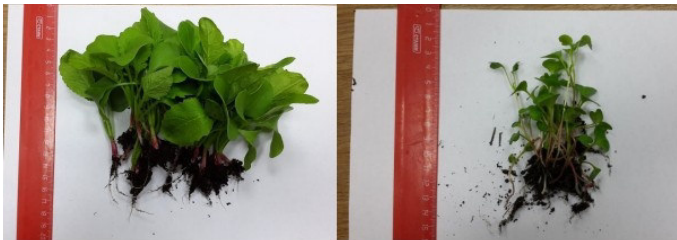
Рис. 2. Контрольная проба G11 (слева) и проба G05 (справа)

Растения контрольной группы (проба G11) на момент сбора (20-й день со дня посадки) также не достигли периода созревания, а достигли ювениального этапа развития, но их масса существенно превышала массу проб, высаженных в естественный грунт. На рис. 2 представлены для сравнения контрольная проба и проба, выросшая на исследуемой урбанизированной территории. Измеренные сырая и сухая массы проб биоматериала приведены в табл. 1