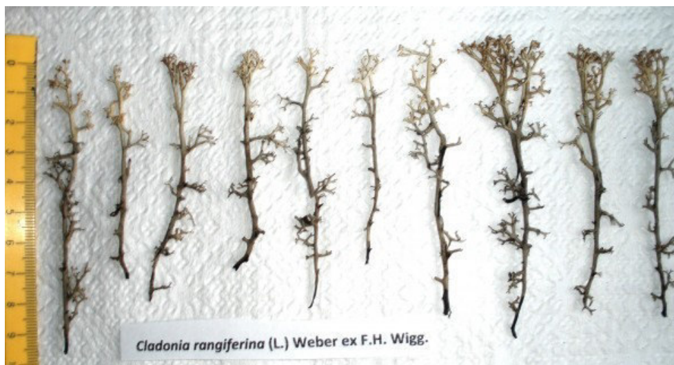
Рис. 1. Объект измерений – 10 подециев C. rangiferina

другие твердые частицы, осевшие на поверхность. Затем измеряемые образцы