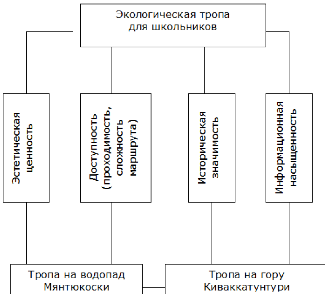
Рис. 4. Схема наглядного содержания задач (этап 2) Fig. 4. Graphic illustration of the content of the task (step 2)

Учитывая приоритеты школьников, выбираем из 2 троп наилучшую с точки зрения выбранных нами приоритетов. Рассмотрим эти две тропы относительно оценок важности, умножим каждую полученную альтернативную оценку по определенному критерию на оценку значимости критерия в свете фокуса и вычислим средний балл, по тропе на гору Киваккатунтури получим 0.31, а по тропе на Мянтюкоски – 0.69. Результаты подсчетов представлены в табл. 5.