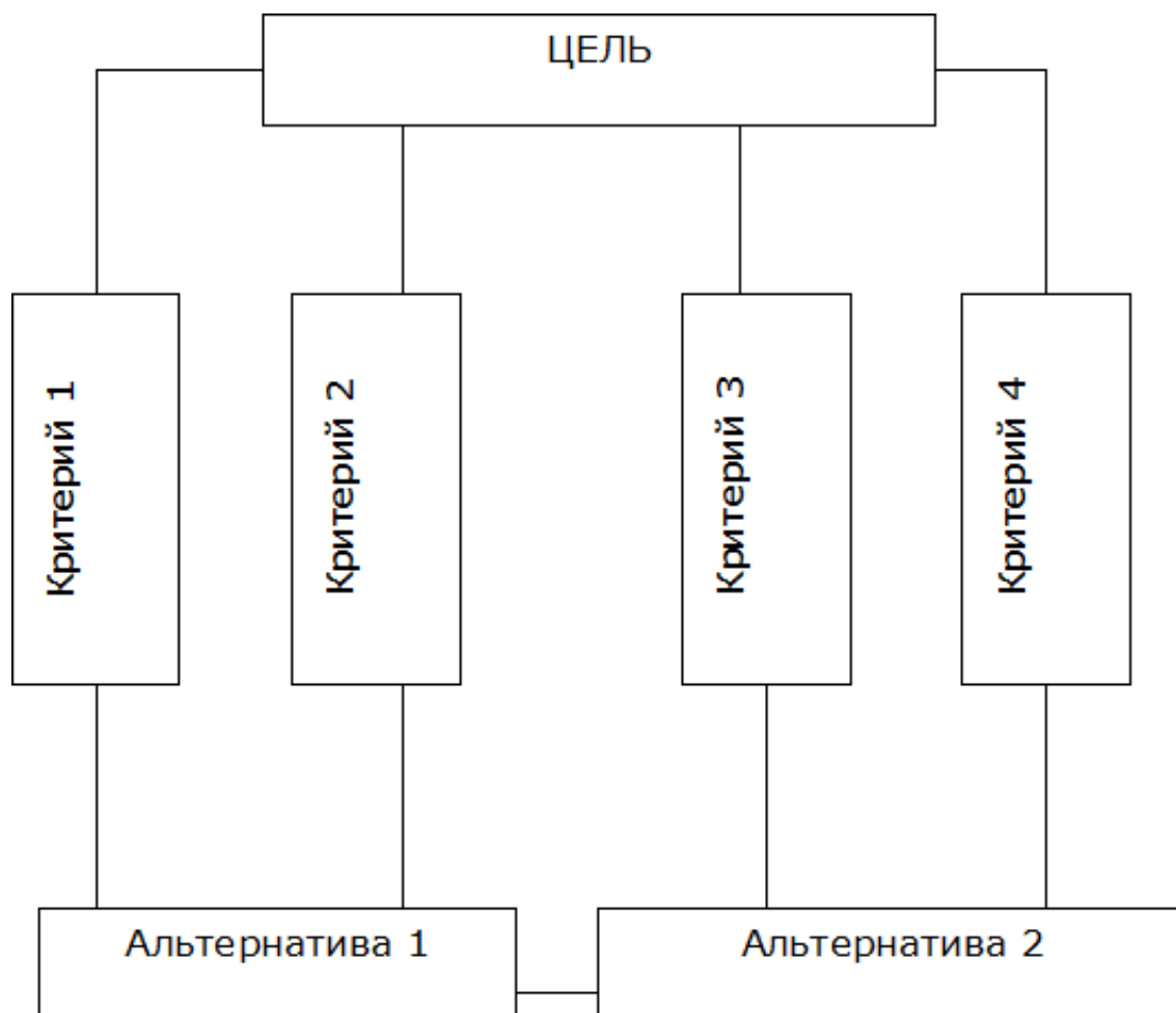
Рис. 1. Общая схема наглядного содержания задачи

Метод анализа иерархий предложен для придания количественной определенности нашим суждениям об относительном вкладе в достижение намеченной цели того или иного элемента изучаемой системы (свойства, фактора, причины, критерия нашей деятельности) (Коросов, 2007, с. 32–35). Само содержание задачи состоит из трех уровней: первый, самый верхний, – это цель. Затем строится второй уровень – критерии. На третьем, нижнем, уровне ставим альтернативы, которые должны быть выражены по отношению к критериям второго уровня (рис. 1).