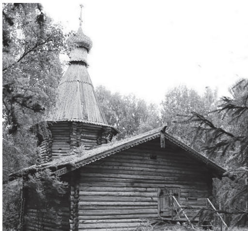
Рис. 1. Муезерский монастырь. Церковь свт. Николая Чудотворца. Вид с запада. 2019 год.

для молитвы, а вторая, квадратная – трапезную. Восточная часть алтаря и трапезная покрыты двускатными слегowymi кровлями. Над западной частью церкви возведен приземистый восьмерик, над ним – шатер с луковичной главкой [7: 179].