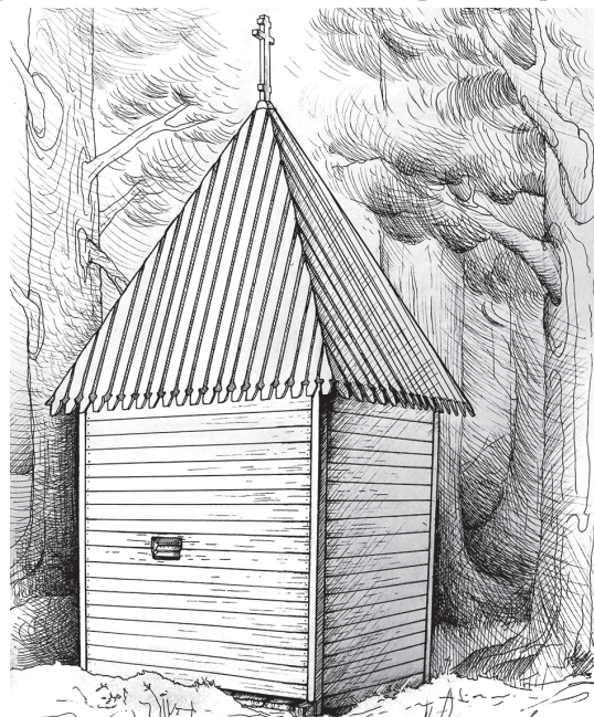
Рис. 2. Муезерский монастырь. Часовня Образа Спаса Нерукотворного. Рисунок М. Александровой

Часовня Образа Спаса Нерукотворного. Деревянный сруб часовни находится в 10,8 м к северо-западу от Никольской церкви, то есть первоначально она располагалась вплотную к зданию храма. Это небольшая клеть, срубленная «в обло» и обшитая тесом. На ней построена четырехгранная шатровая кровля, увенчанная деревянным восьмиконечным крестом (рис. 2).