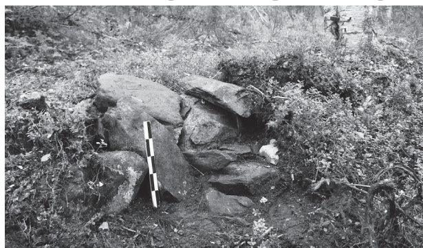
Рис. 3. Муезерский монастырь. Валунная «ограда». Вид с востока. 2019 год.

пристани к церкви, вторая – на деревню Авдеево на противоположном берегу озера. Существующий значительный незаполненный разрыв между «оградками» можно объяснить незаконченностью сооружения или возможным восполнением недостающих участков по периметру обители «облегченным» вариантом жердевой изгороди.