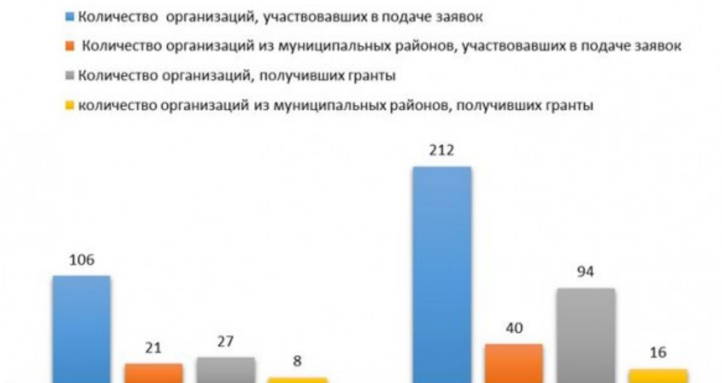
Рис.1. Количество грантозаявителей и грантополучателей в конкурсах 2013—2018 гг.

Первое, на что следует обратить внимание, это существенное увеличение в 2017—2018 годах количества и организаций — грантозаявителей, и организаций — грантополучателей. Сравнение данных по количеству участвующих в конкурсах организаций и результатов этого участия представлено в нижеследующей диаграмме (Рис.1).