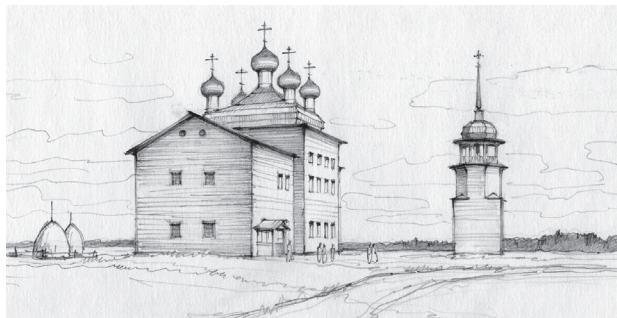
Рис. 2. Графическая реконструкция Преображенской церкви (1878), колокольни (1764) в начале XX века. Реконструкция А. Б. Бодэ

Figure 2. Graphic reconstruction of the Transfiguration Church (1878), and the bell tower (1764) in the early XX century by A. B. Bode