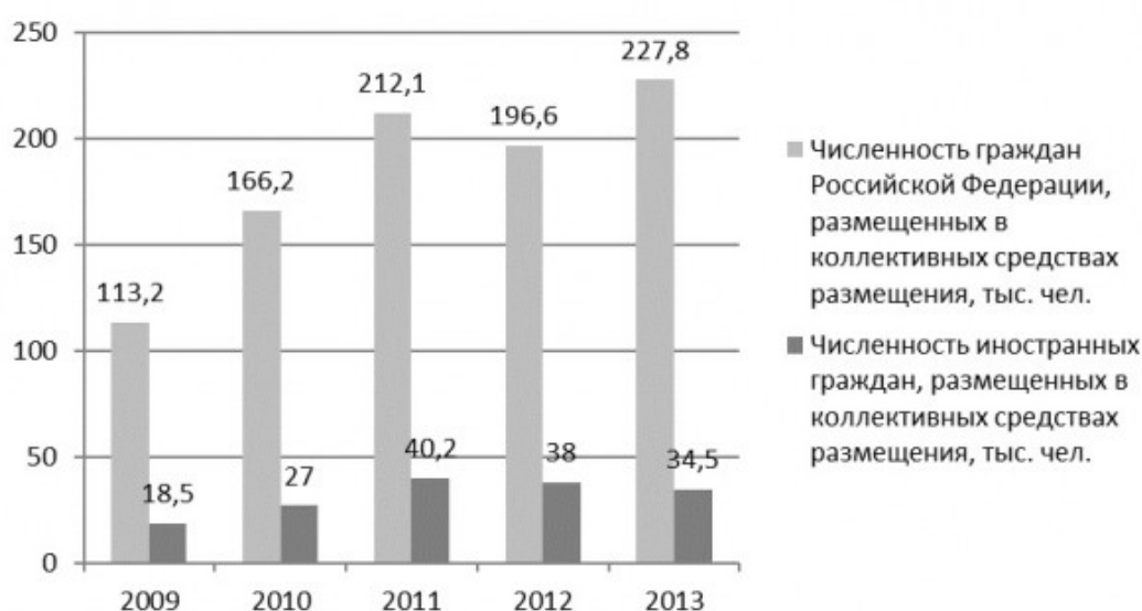
Рис. 2 Численность граждан, размещенных в коллективных средствах размещения по Республике Карелия, тыс. чел. [7]

В общем объеме платных туристских услуг доля Республики Карелия в период 2009—2013 гг. составляла 0,47—0,69 % от общероссийского показателя и 3,96—5,92 % от показателя по Северо-Западному федеральному округу, причем наименьшие значения относятся к 2013 г. В целом докризисные показатели развития туризма в Карелии не имели устойчивой тенденции роста (см., например, рис. 2). Сильные и слабые стороны, угрозы и возможности карельского туризма в целом соответствовали общероссийским. В качестве особенностей Карелии можно отметить приграничное положение, близость к крупным туристским центрам (Санкт-Петербург), большое количество культурно-исторических объектов, многообразие предложений в сфере активного туризма.