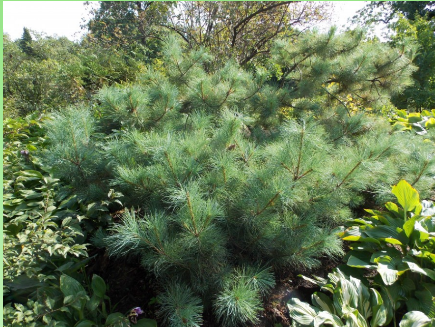
Рис. 2. Pinus pumila в Ботаническом саду Петра Великого (уч. 71).

лесотехнического университета 4 экз. Pinus pumila на уч. 28 (59°59'36.8"N, 30°20'25.8"E). Эти растения выращены в питомнике ботанического сада Л. А. Семёновой из 2-3 летних сеянцев, привезенных с полуострова Камчатка в 1991 г. и высаженных в дендросад в 1999 г.