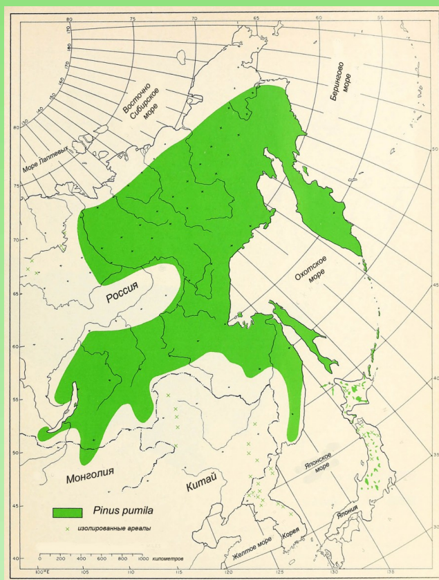
Рис 1. Карта естественного ареала Pinus pumila (Pall.) Regel (по: Critchfield & Little, 1966).

Восточная граница ареала проходит от Анадырского лимана на остров Медный, через южную оконечность Камчатки и Курильские острова до Японии.