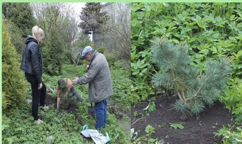
Рис. 5. Посадка Pinus pumila (Pall.) Regel в Ботаническом саду Санкт-Петербургского государственного университета.

В Ботаническом саду Санкт-Петербургского государственного университета до весны 2019 г. не было ни одного экземпляра этого вида. Авторами данной статьи в мае 2019 г. на альпийских горках Ботанического сада (59°56'29.9"N, 30°17'46.7"E) были посажены 2 экземпляра кедрового стланика. Эти растения выращены на Карельском перешейке, в пос. Мельниково (60°54'33.5"N, 29°48'00.9"E) из семян, собранных на восточном склоне горы Глиняной на высоте около 800 м н.у.м. (53°13'15.0"N, 158°08'16.5"E), п-ов Камчатка в 2008 г. На момент посадки растения в возрасте 10 лет, высотой 50–60 см., с голубоватой хвоей, жизненное состояние по В. А. Алексееву (1989) – 1, растения находятся в вегетативном состоянии.