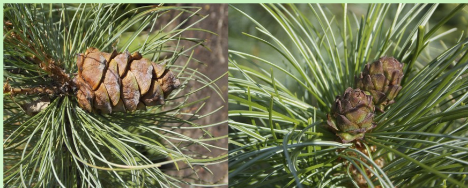
Рис 3. Семеношение Pinus pumila в Ботаническом саду Петра Великого (уч. 71 и 98), шишки перед созреванием.

Fig. 2. Pinus pumila at the Botanical Garden of Peter the Great (section 71).