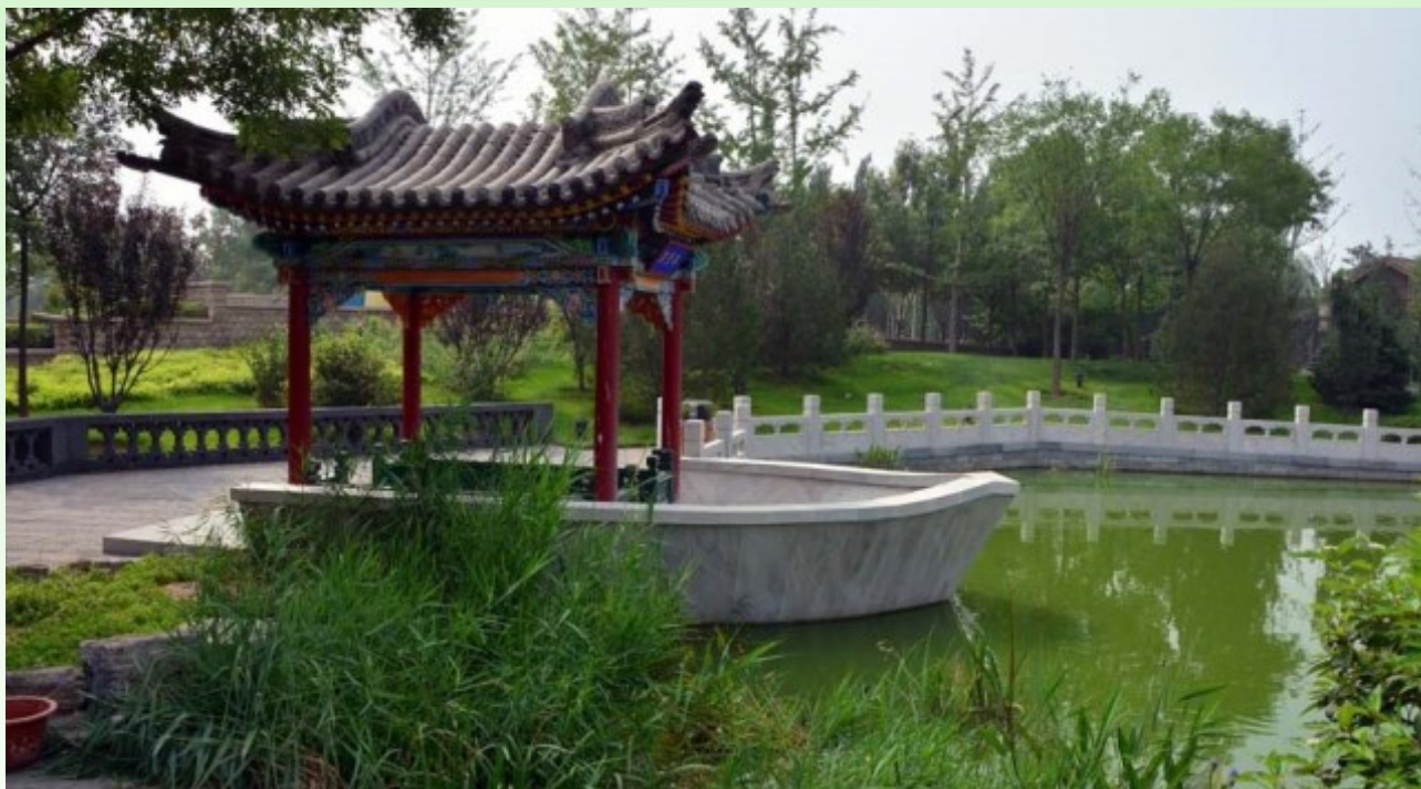
Рис. 13. «Плывущая беседка». Тростники, на заднем плане - Ginkgo boliba , Prunus purpureus .