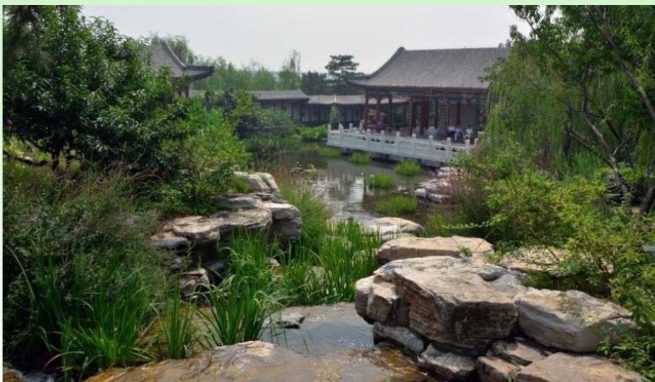
Рис. 7. Классические элементы китайского сада: камень, вода, мостики, крыши, растения.

Fig. 6. Classic chinese gardens, including obligatory elements Malus , Prunus , Bamboo , tree Paeonia , curved roads , and a gazebo .