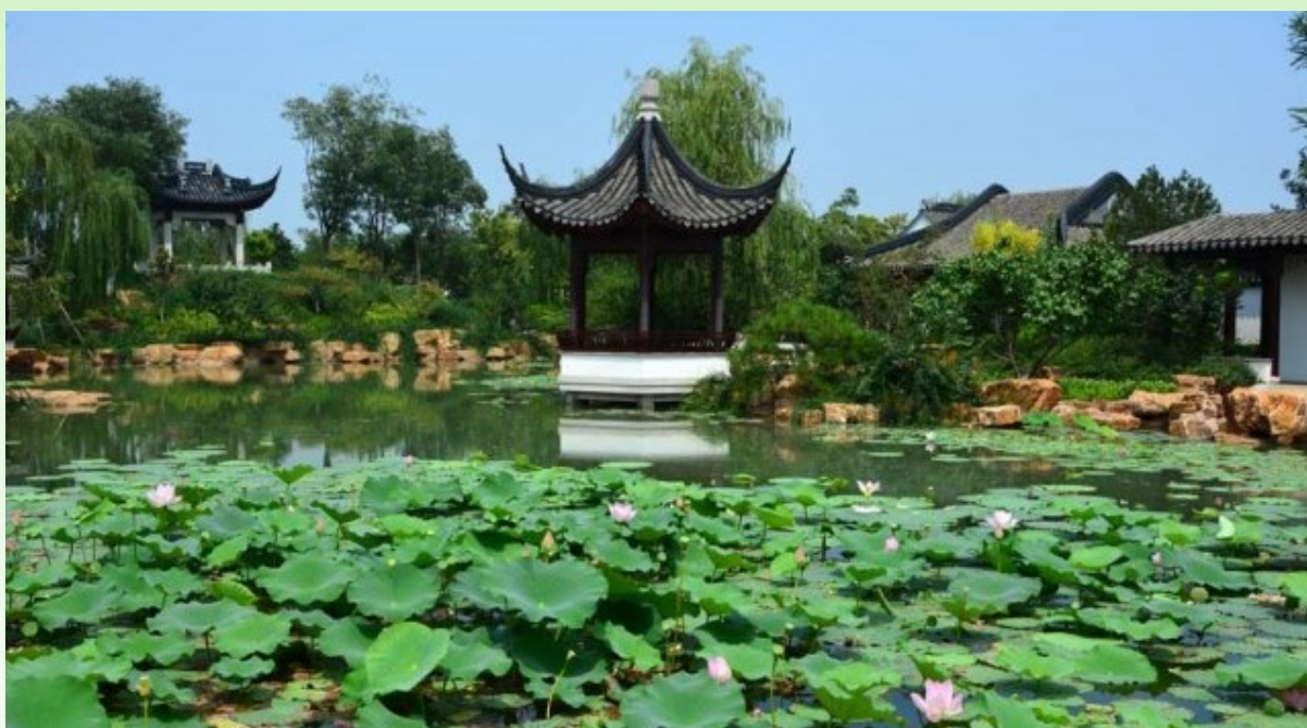
Рис. 17. «Беседка на лодке» на берегу пруда с лотосами. Урез воды закрыт камнем. Слева - беседка на возвышенности - для обозрения площади парка и пруда. Справа - крытые галереи.

Fig. 16. Classic yard of Chinese nobility of XVII-XIX centuries. Shaped windows on the wall. Wall of different-sized blocks. Indoor gallery. A visible embrasure in the wall has a large mirror, which significantly expands the space of the garden. Exposition of young designers of Beijing.