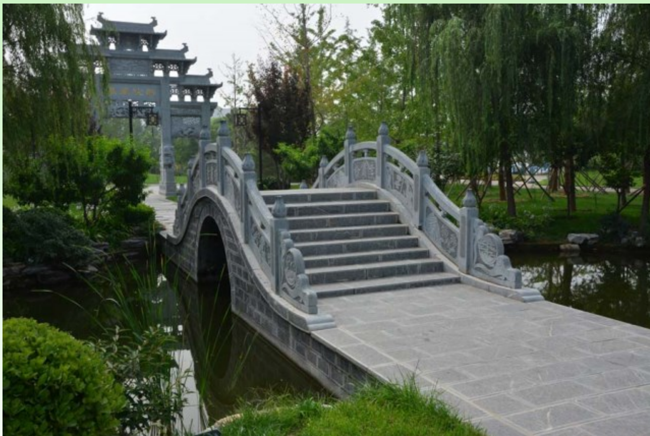
Рис. 5. Сады, сделанные в классическом стиле. Типичный верблюжий мостик.

Fig. 4. Entrance to the Park presented by the city of Ordos city, Inner Mongolia.