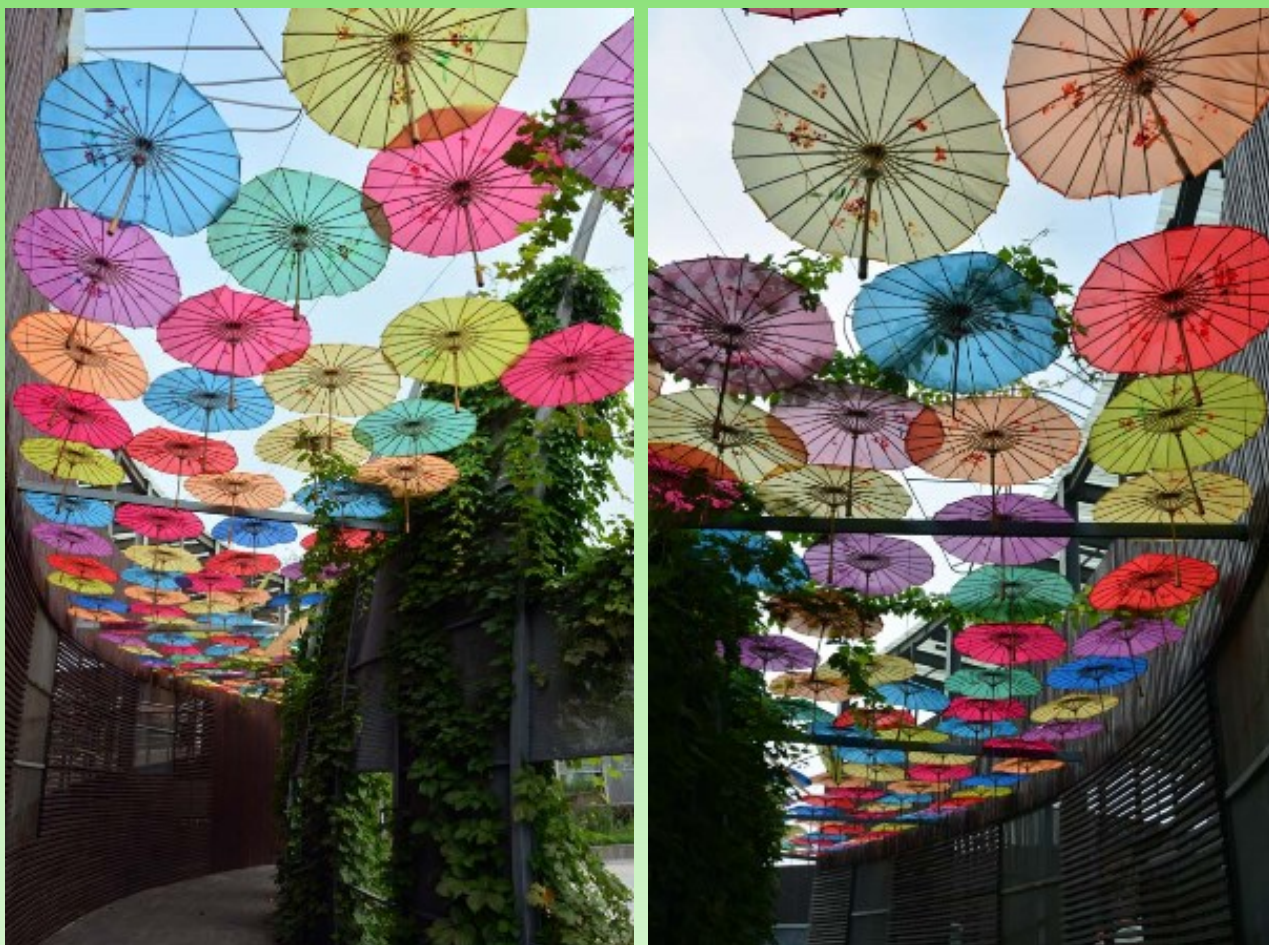
Рис. 31. Галерея зонтиков - элемент сада, который создали дизайнеры провинции Гуандун.