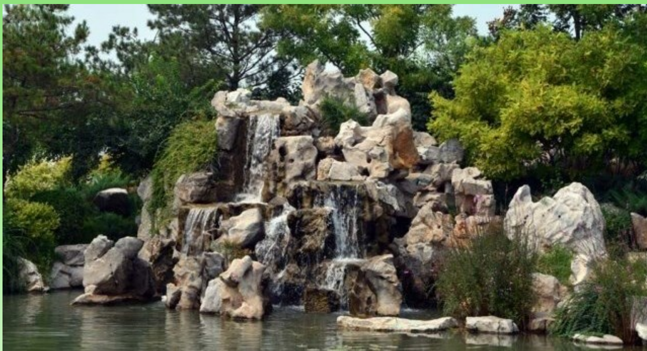
Рис. 14. Камень (сложенный вручную) и водопад так же ручной работы.