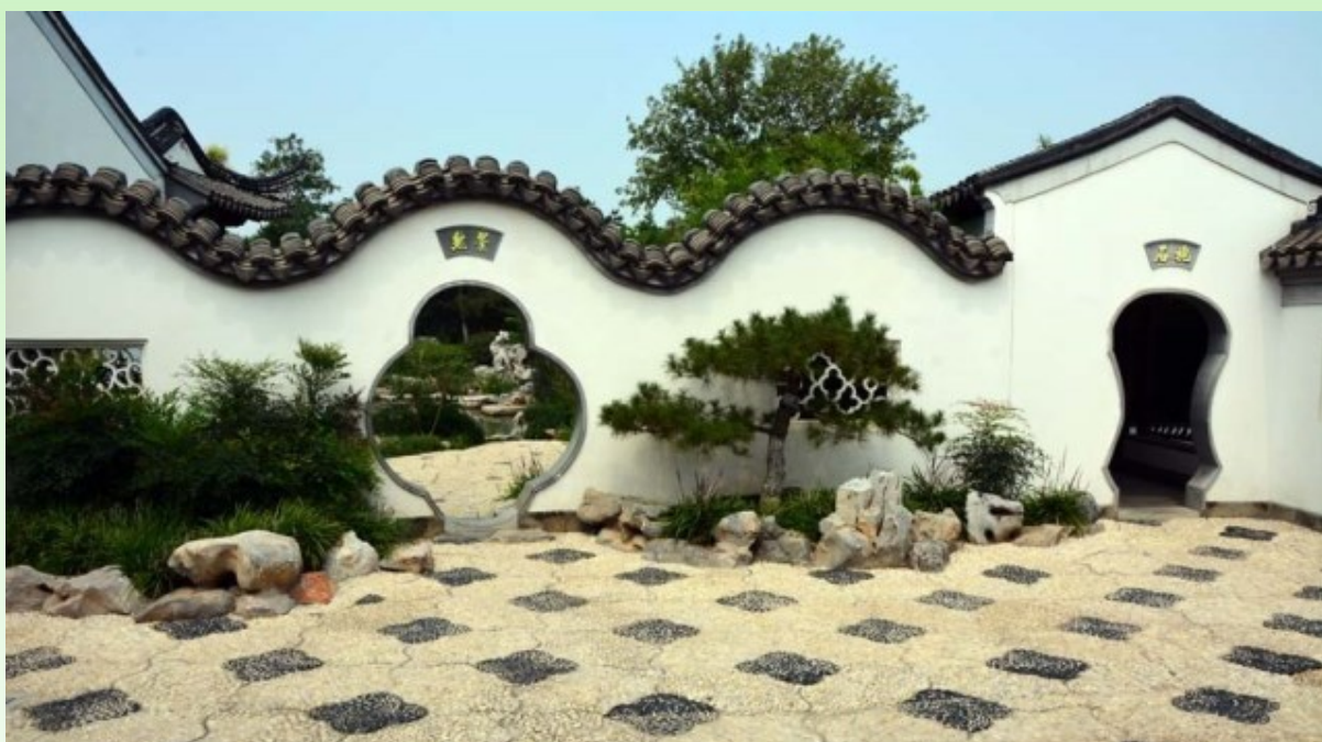
Рис. 9. Плитка уложена как "цветок сливы, разрушающий лёд". Фигурные (или лунные) проходы. Фигурные окна. Крыша стены - извивающийся дракон.

Fig. 8. One of the main elements of a Chinese garden - the moon gate.