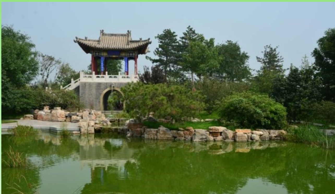
Рис. 12. Верблюжий мостик с беседкой. Каменное обрамление уреза воды, ступеньки и беседка, фигурный проход под беседкой (отражение в виде круга), разные виды растений.