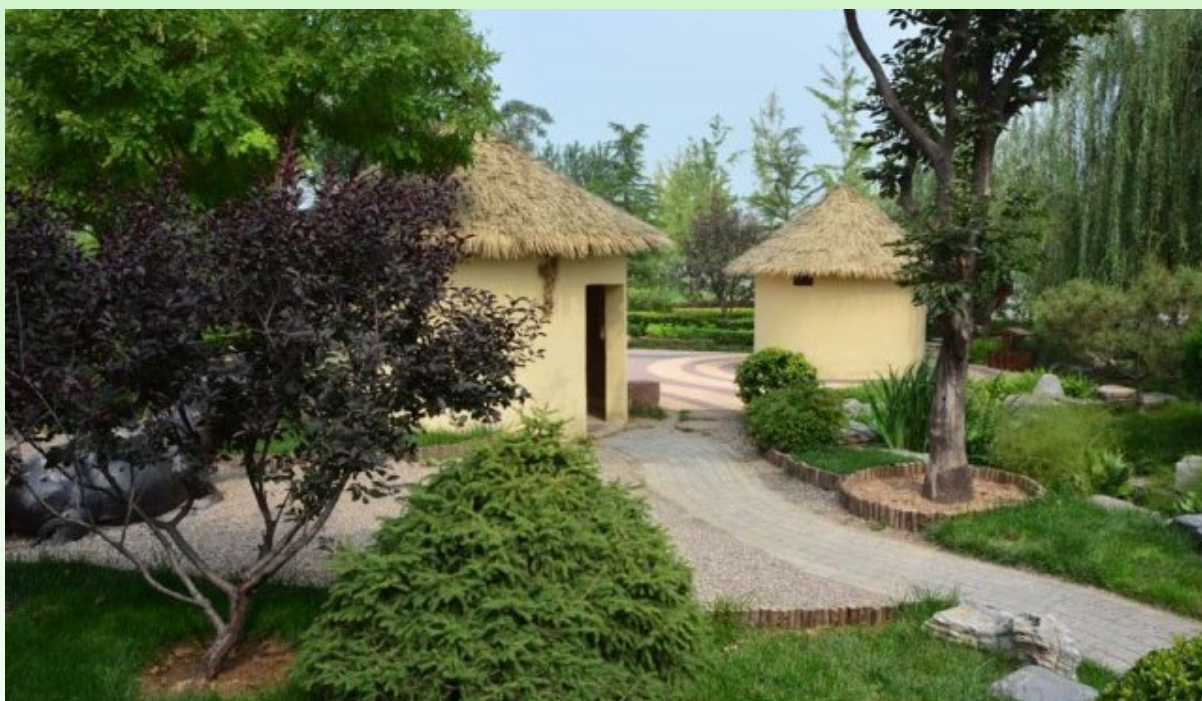
Рис. 19. Современная дизайнерская реконструкция южно-китайской деревни с элементами современного паркового дизайна. Слева видна фигура быка, на переднем плане слева - слива краснолистная, извилистые дорожки, выложенные разными плитками и камешками. Присутствует "дикий" (не обработанный) камень.

Fig. 18. Park carved wooden Gazebo on the bank of a pond.