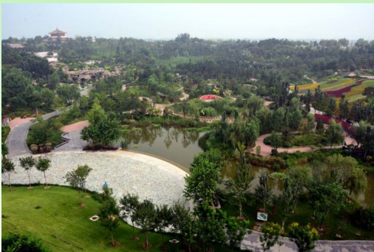
Рис. 3. «Парчовая долина».