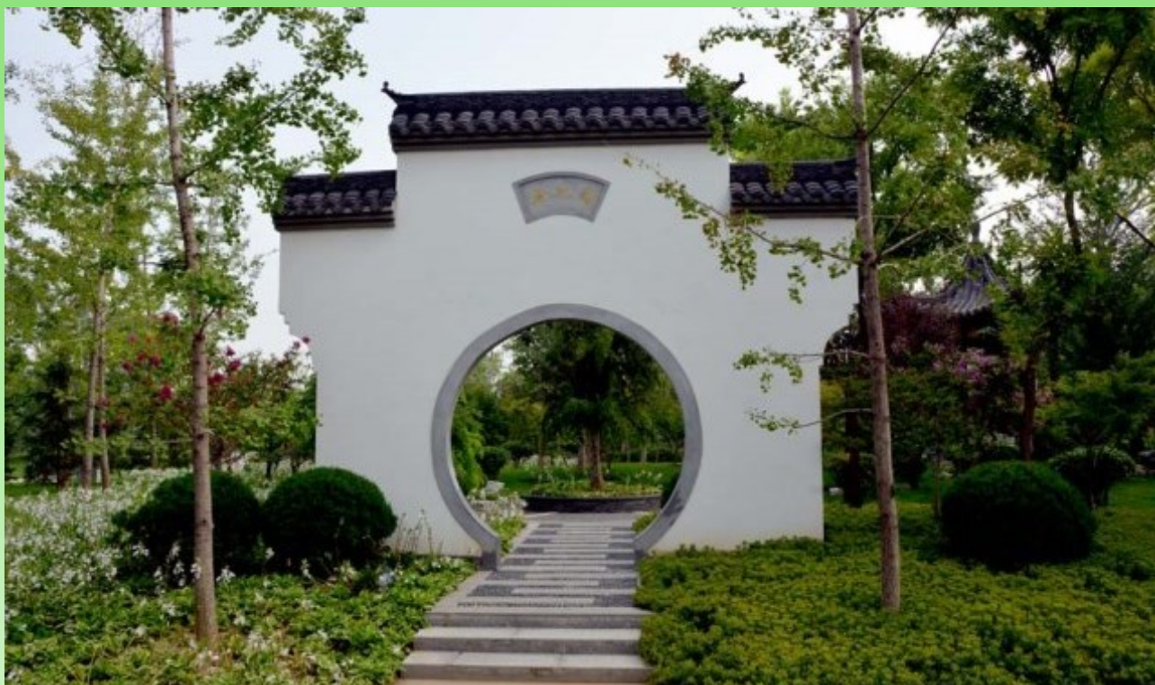
Рис. 8. Один из обязательных элементов китайского сада - лунные ворота.

Fig. 8. One of the main elements of a Chinese garden - the moon gate.