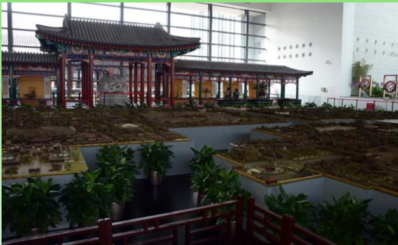
Рис. 26. Макет-панорама исторических садов вокруг Пекина.

Fig. 26. The panorama-view of historical gardens around Beijing.