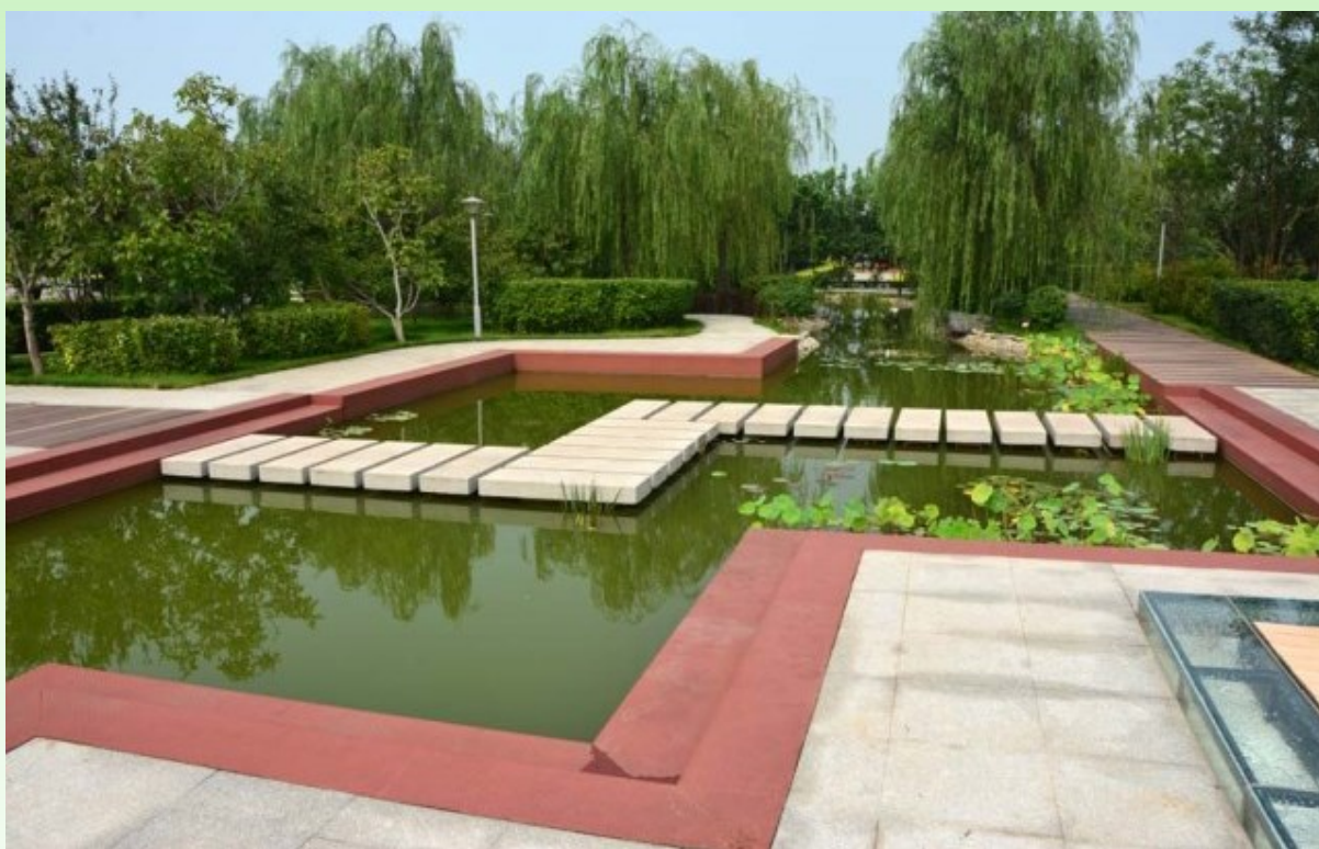
Рис. 21. Сад в стиле Hi Tech. Основные элементы сохранены: пруд (вода), камень (дорожка), "сломанный" мостик, растения.