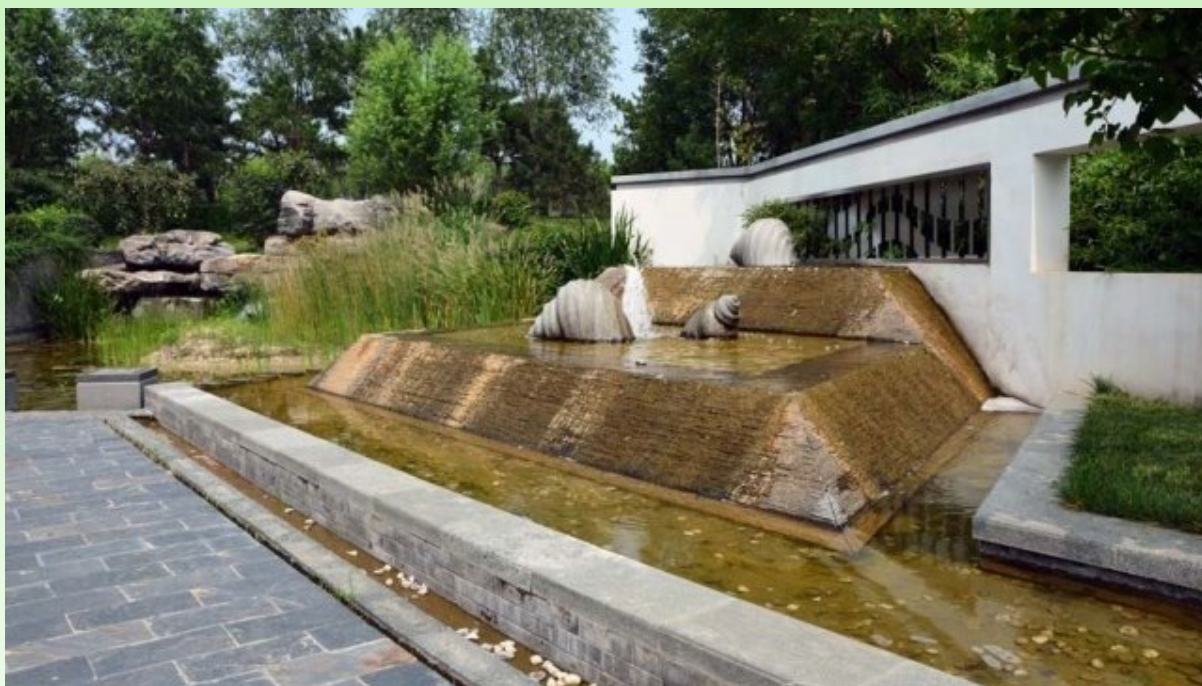
Рис. 23. Сад города Наньнин, провинция Гуйчжоу. Вода (в том числе - "падающая"), ломаные линии, стены с фигурными окнами.

Fig. 22. Hi Tech style gardens. A park dedicated to the pandas.