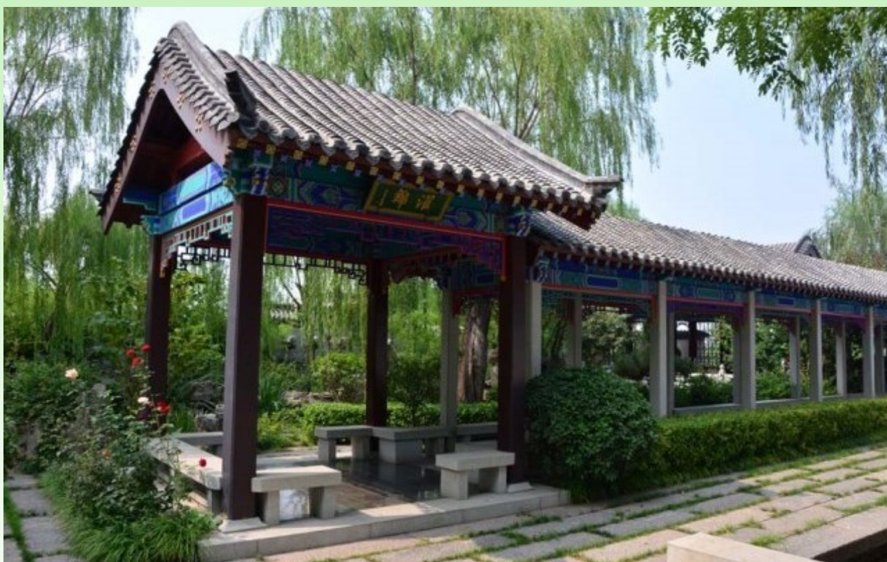
Рис. 15. Традиционная крытая прогулочная галерея. Стриженный кустарник. Плитка (каменная), деревья, дающие нежную ажурную тень. Перед галереей и за ней - пруды-каналы с рыбами.