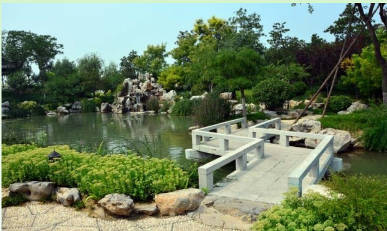
Рис. 11. Через мостик с прямыми углами за вами не может пройти нечистая сила, и, переходя на другую сторону, в саду или в парке вы уже свободны от преследования "нечистых сил".

Fig. 10. A Moon passage between the yards. Shaped windows. Levelled roof, tiles with stone patterns, a moon passage. Use of natural stone (for stairs and border" is obligatory. Plants covers the angle between the walls.