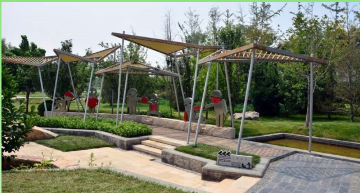
Рис. 24. Сад города Наньнин, провинция Гуйчжоу. Дизайнерские находки.