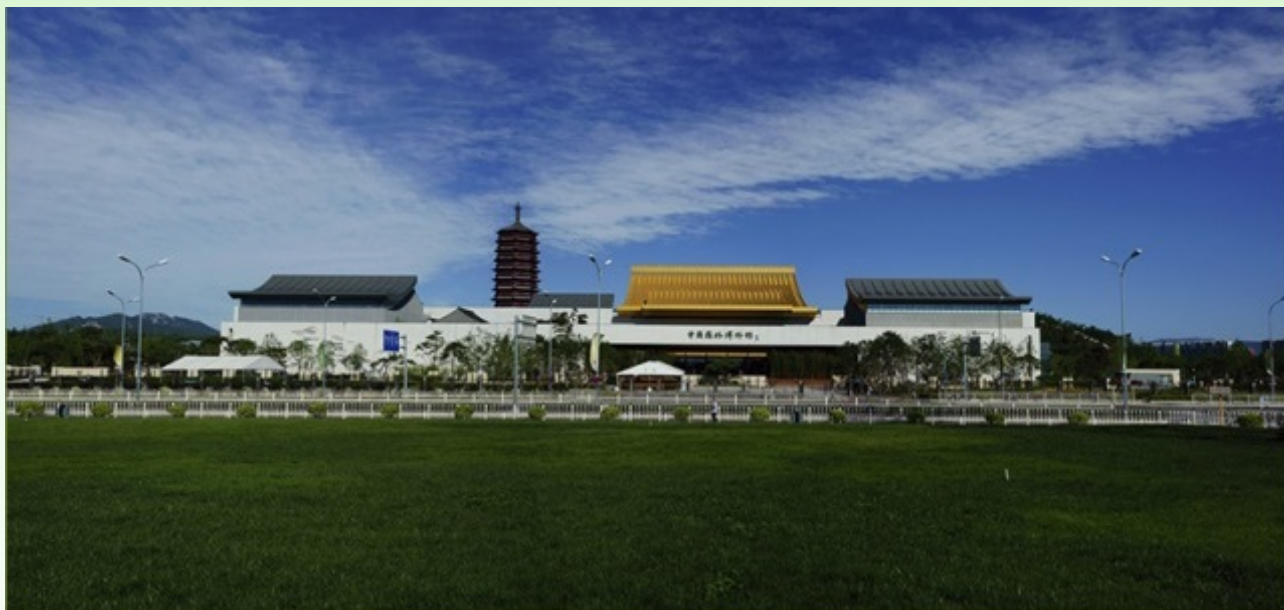
Рис. 25. Музей истории и развития ландшафтной архитектуры и садового дизайна Китая.

На территории этого громадного парка есть ещё и большой музей истории и развития ландшафтной архитектуры и садового дизайна Китая The Museum of Chinese Gardens and Landscape Architecture (MCGALA) (рис. 25–30). Посещение его бесплатно, так как на входе в парк посетители приобретают входные билеты. В этом музее есть как основные, постоянные экспозиции истории развития садового искусства в стране, так и часть отведена для проведения разнообразных временных выставок.