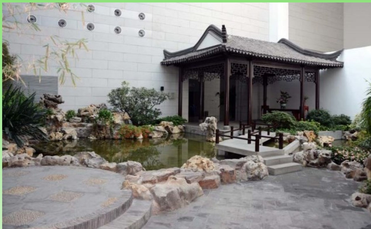
Рис. 28. Внутри здания сделано несколько типичных внутренних двориков. Присутствуют все главные элементы сада: природный камень, ломаный мостик, пруд, беседка (крытая галерея), бамбук, закрытые растениями углы, крытые плиткой дорожки.

Fig. 28. Several typical patios inside the building. There are all of the main elements of a garden: natural stone, a broken bridge, a pond, a gazebo (an indoor gallery), bamboo, corners covered with plants, tiles roads.