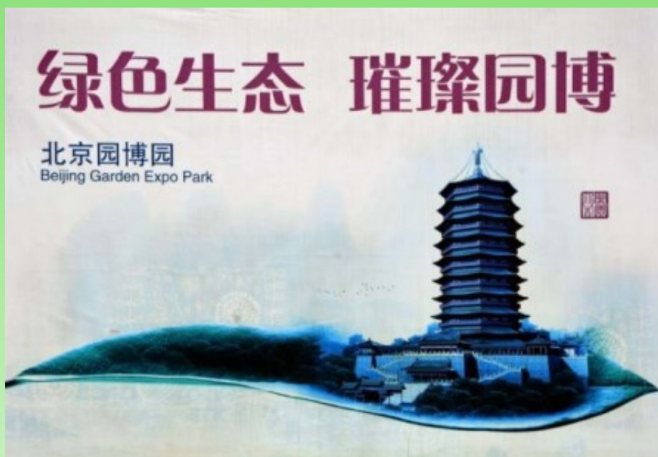
Рис. 2. Символ пекинского выставочного Сада-Парка – Башня Юндин.