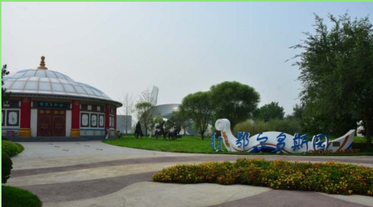
Рис. 4. Начало территории парка от города Эрдос, Внутренняя Монголия.

Fig. 4. Entrance to the Park presented by the city of Ordos city, Inner Mongolia.