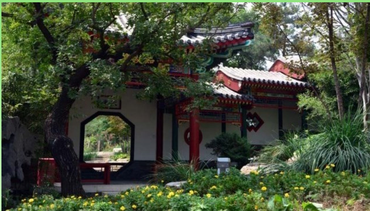
Рис. 16. Классический дворик китайской знати XVII-XIX веков. Фигурные окна в стене. Стена из разновеликих блоков. Крытая галерея. Видимый проём в стене – вставленное большое зеркало, значительно расширяющее пространства сада. Экспозиция молодых пекинских дизайнеров.

Fig. 16. Classic yard of Chinese nobility of XVII-XIX centuries. Shaped windows on the wall. Wall of different-sized blocks. Indoor gallery. A visible embrasure in the wall has a large mirror, which significantly expands the space of the garden. Exposition of young designers of Beijing.