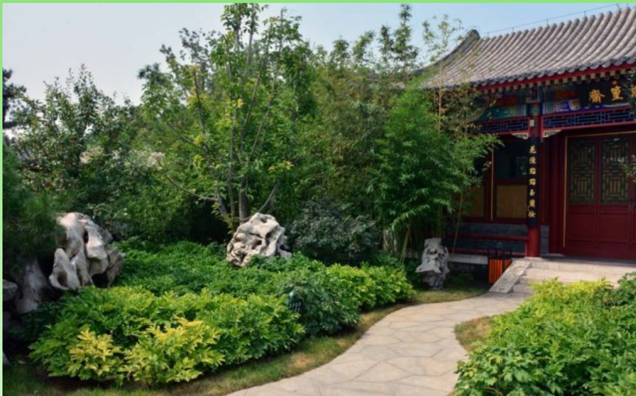
Рис. 6. Традиционный сад, включающий обязательные элементы - яблони, сливы, древовидные пионы, бамбук; кривые дорожки, беседку или какое-то строение.

Fig. 6. Classic chinese gardens, including obligatory elements Malus , Prunus , Bamboo , tree Paeonia , curved roads , and a gazebo .