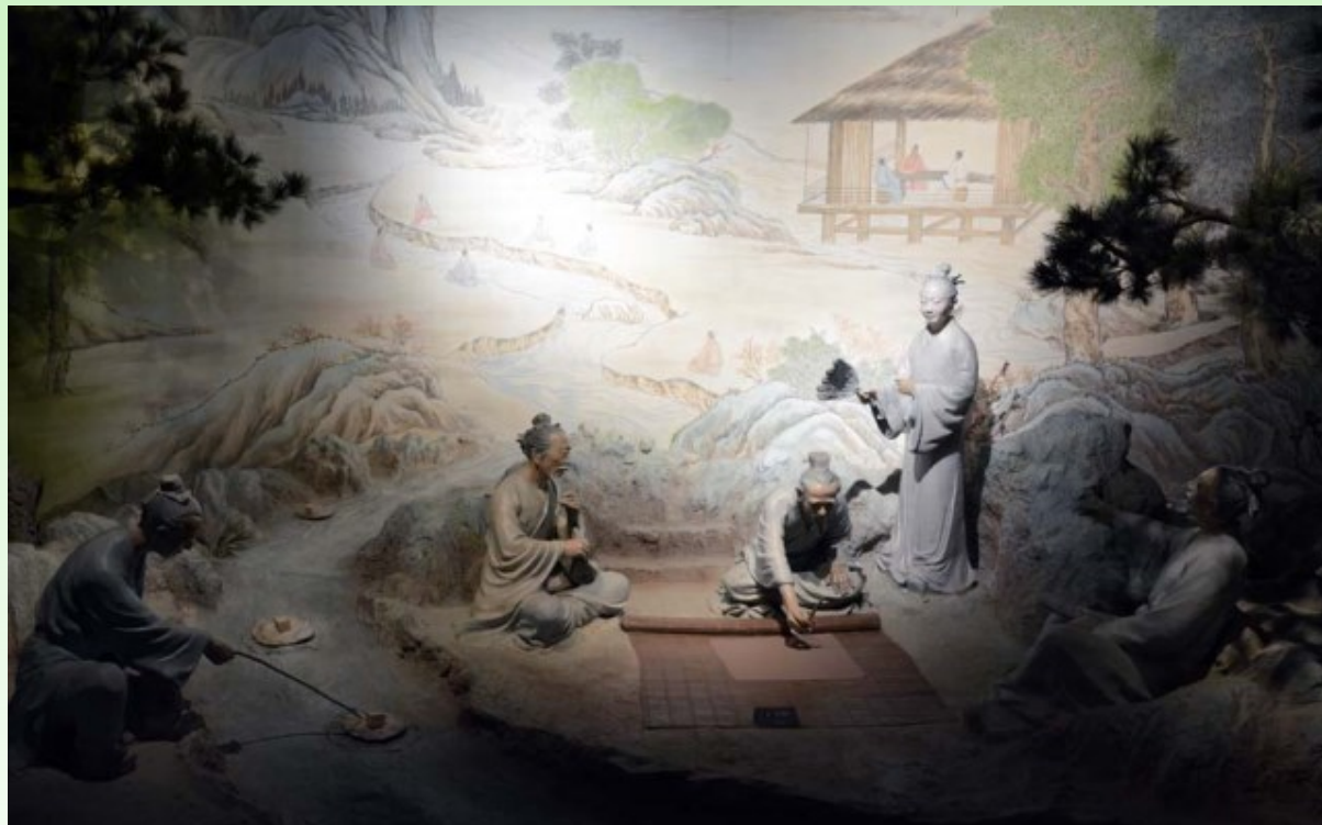
Рис. 27. Сценки из жизни и работы садовников, занятых разработкой проекта нового сада.

Fig. 26. The panorama-view of historical gardens around Beijing.