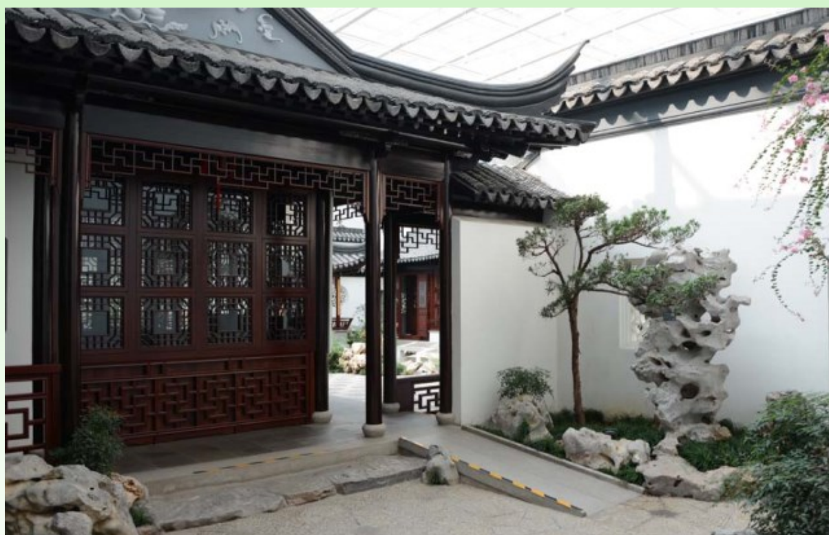
Рис. 29. В следующем дворике представлены: фигурное окно, фигурный природный камень, разные виды растений, ступеньки, крыши, стена.

Fig. 28. Several typical patios inside the building. There are all of the main elements of a garden: natural stone, a broken bridge, a pond, a gazebo (an indoor gallery), bamboo, corners covered with plants, tiles roads.