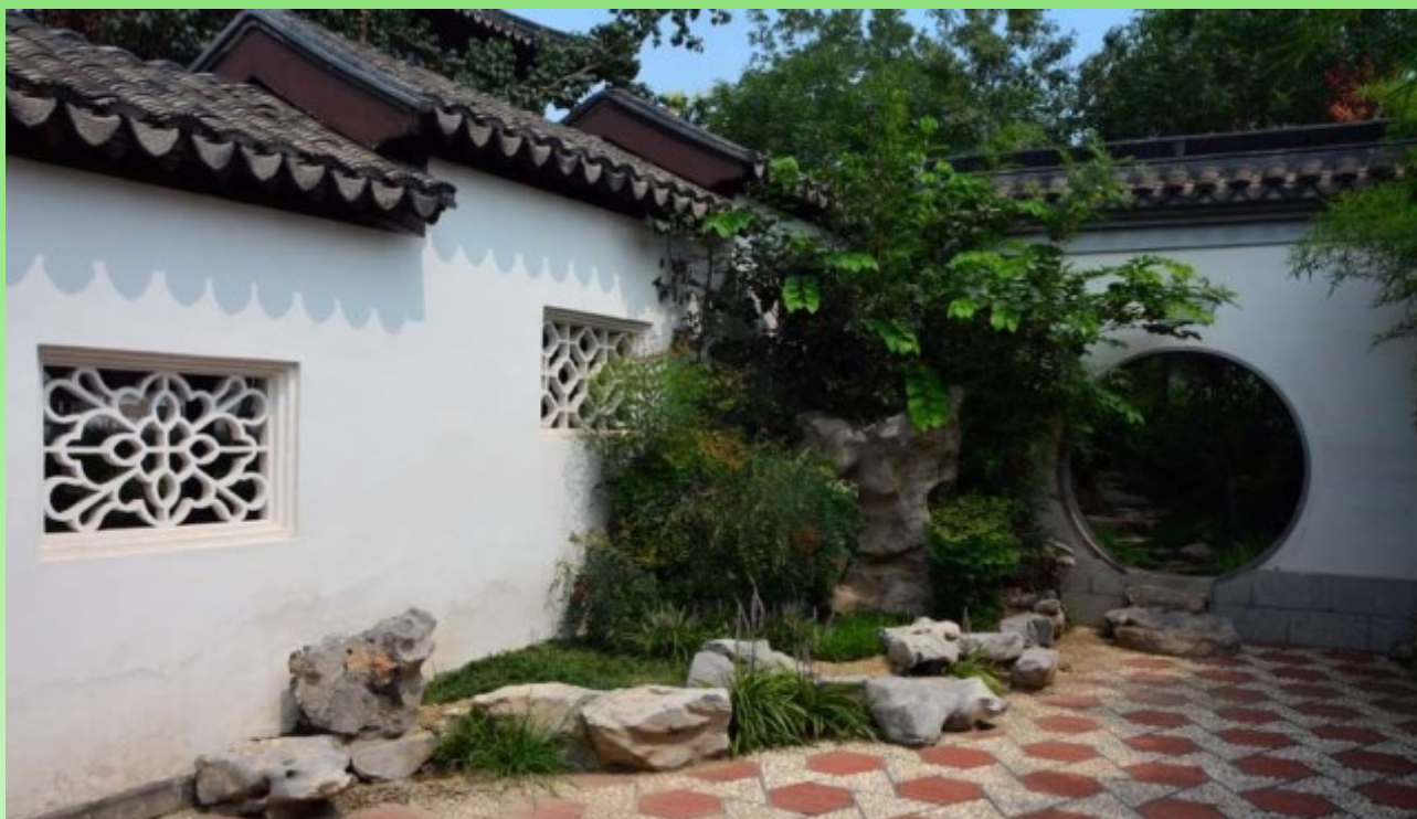
Рис. 10. Переход между внутренними двориками. Фигурные окна. Крыша разного уровня, плитка с камешками в виде рисунка, "лунный" проход. Обязательно - природный камень (как бордюры и как ступеньки). Закрытый растениями угол стен.

Fig. 10. A Moon passage between the yards. Shaped windows. Levelled roof, tiles with stone patterns, a moon passage. Use of natural stone (for stairs and border" is obligatory. Plants covers the angle between the walls.