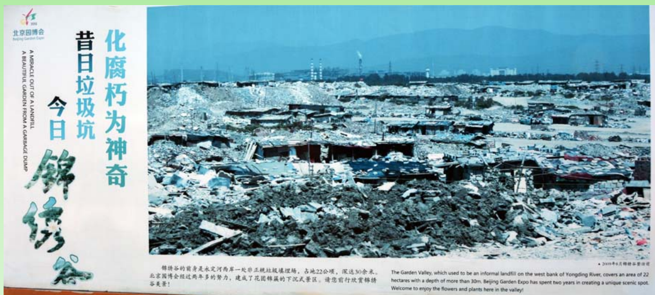
Рис. 1. Фотография на аншлаге в парке исходной территория мусорной свалки, существовавшей до 2010 года, на которой теперь создан пекинский Экспо парк - Beijing Garden Expo Park.

Настоящее сообщение посвящено новому, открытому в 2013 году, уникальному ландшафтному парку Пекина. Это повествование о том, как на месте бывшей городской свалки, загрязняющей водозабор, за несколько лет был создан новый оригинальный парк. В нём представлено традиционное и современное парковое искусство Китая. Это настоящий public botanical garden, имя которому – Beijing Garden Expo Park (рис. 1), который расположился вдоль западного берега реки Юндин (Yongding River), городского района Пекина – Fengtai. Здесь и далее привожу написание китайских названий на английском, как они даны в путеводителях и справочниках, чтобы не допускать разночтения и разнонаписания.