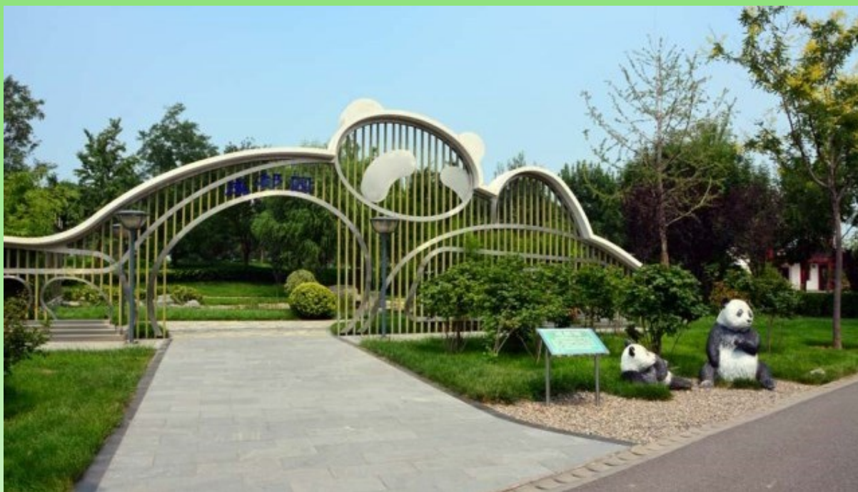
Рис. 22. Сад в стиле Hi Tech. Парк, посвящённый пандам.

Fig. 22. Hi Tech style gardens. A park dedicated to the pandas.