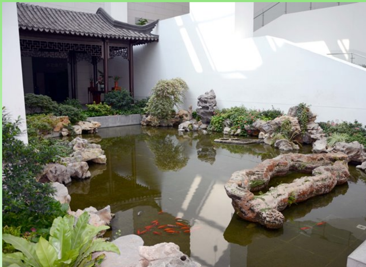
Рис. 30. Внутри здания представлены разные варианты классических "внутренних" садиков. И здесь так же есть все главные атрибуты китайского сада - камень, вода, растения, рыбы.