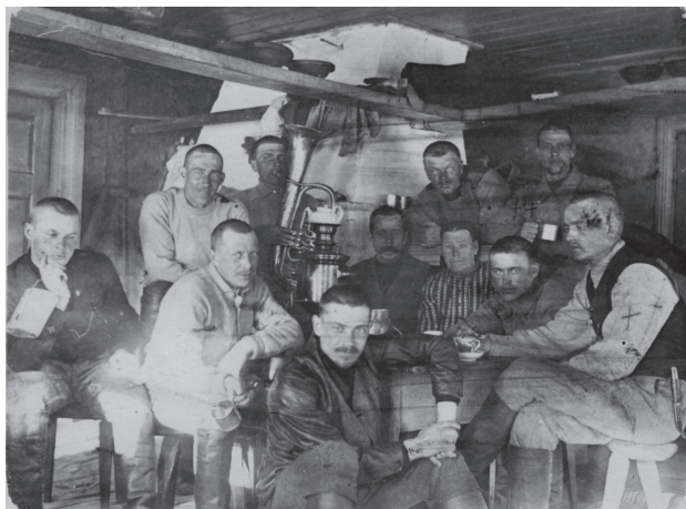
Рис. 2. Финские бойцы племенных войск в Ухте весной 1918 года

Великобритания совершила высадку своих морских пехотинцев в Мурманске весной 1918 года. Возникает вопрос: а что британцы делали в это время на севере России? Неужели у них не было своих забот с Германией на западном фронте? За этим стоит Брестский мир, заключенный 3 марта 1918 года в Брест-Литовске, по которому Советская Россия вышла из мировой войны и этим высвободила десятки германских дивизий для использования на западном фронте. В то же самое время, когда Лондон получил информацию о Брестском мире, пришла и весть о высадке немцев в Финляндии. Совпадение по времени этих событий дало британскому военному командованию и Министерству иностранных дел почву для предположений, что Германия намеревается использовать Финляндию как плацдарм для атаки на Россию 4 .