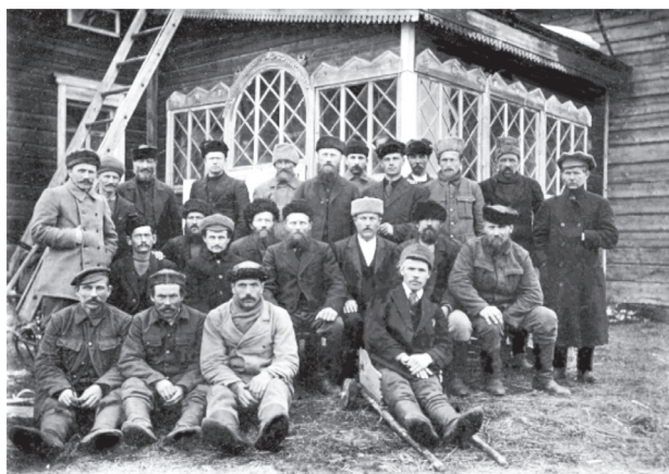
Рис. 3. Делегаты Вокнаволоцкой волости на Ухтинском съезде представителей карельских волостей в марте 1920 года (Карельское просветительское общество, электронная база данных «Сампо»: www.karjalansivistysseura.fi/sampo )

Во время Съезда представителей карельских волостей в Ухте находился также красноармейский отряд и некоторые агитаторы советской власти. Их красноречивые выступления о светлом будущем в составе Советской России не убедили карельских делегатов. Съезд принял распоряжение о том, чтобы агитаторы и красноармейские части покинули Ухту, что и было исполнено.