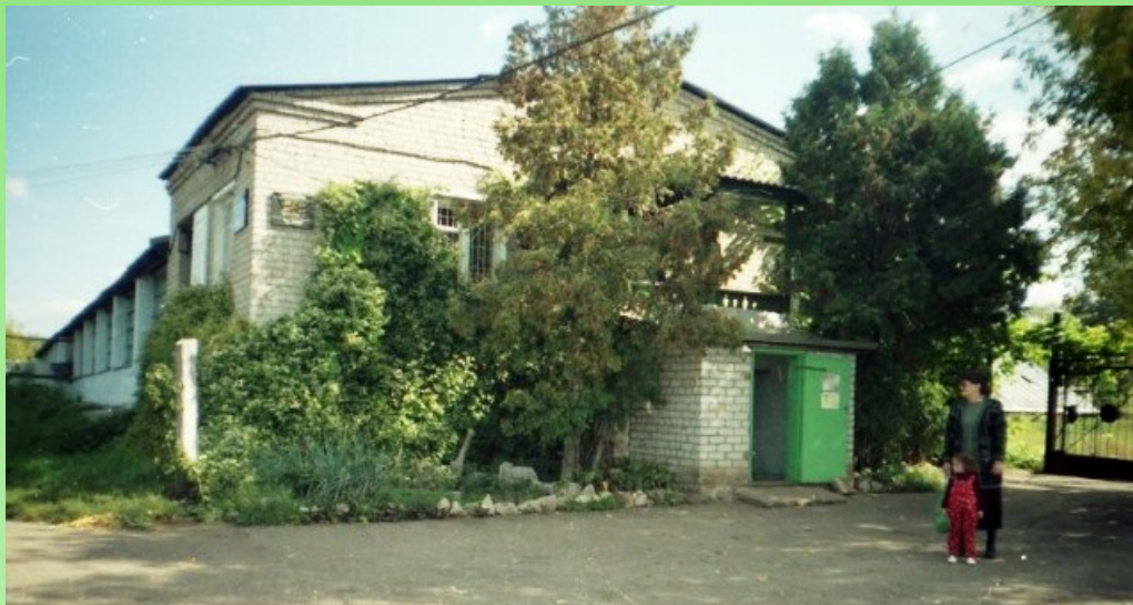
Рис. 5. Оранжерея Ботанического сада Куйбышевского государственного университета, конец 90-х годов.

Тетрастигма Вуанье (Экскурсия ..., 1967). С 1967 года одной из тем исследований стала тема: «Внедрение в производство комнатно-оранжерейных декоративных растений для озеленения цехов и общественных помещений». Сотрудниками оранжереи были созданы зелёные уголки в цехах нескольких заводов г. Куйбышева.