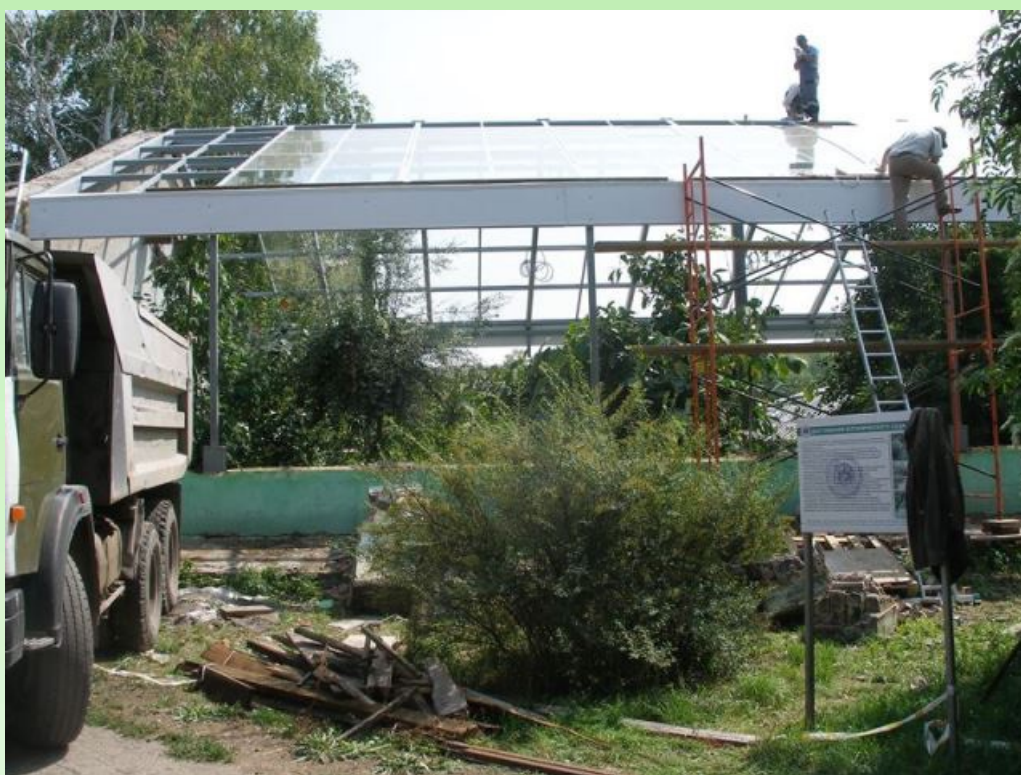
Рис. 11. Ремонт оранжереи, 2016 г.