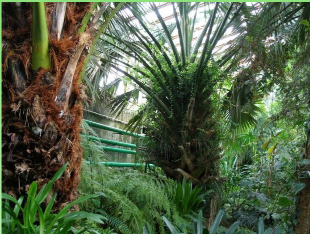
Рис. 10. Тропический зал, 2007 г.