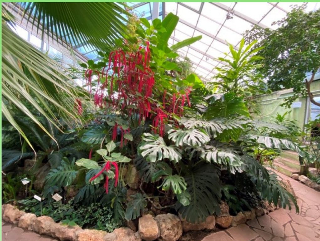
Рис. 14. Тропический зал, 2020г.