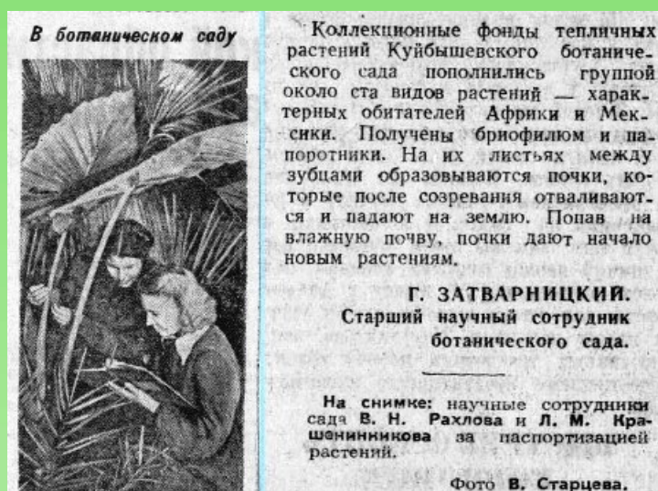
Рис. 2. Заметка в газете "Волжская коммуна" от 12.02.1950 г.