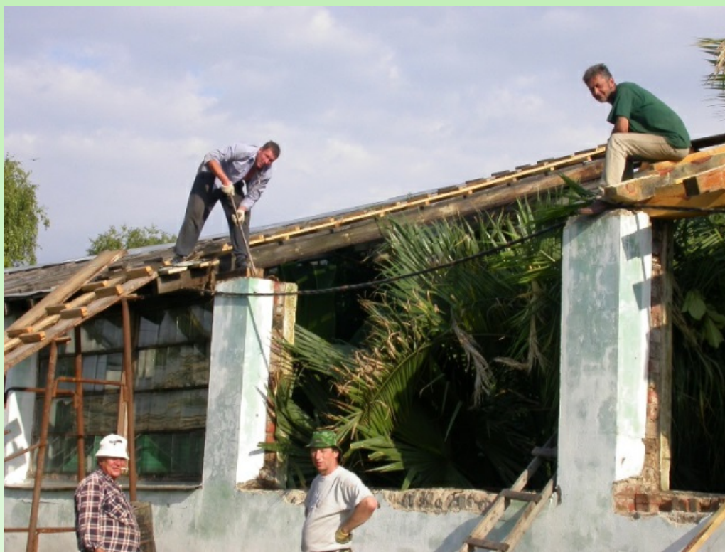
Рис. 7. Ремонт крыши, 2004 г.

В 2015 году, после слияния Самарского государственного университета и Аэрокосмического университета, Сад был включен в состав Самарского национального исследовательского университета имени академика С. П. Королёва. В 2016-2017 годах провели очередную реконструкцию оранжереи: полностью переделали крышу, подняв её на 70 см (теперь максимальная высота крыши в тропическом зале составила 8,5 м), и заменили деревянную конструкцию на металлическую, поменяли системы отопления и освещения, обновили дорожки в больших залах, сделали вентиляцию (рис. 11).