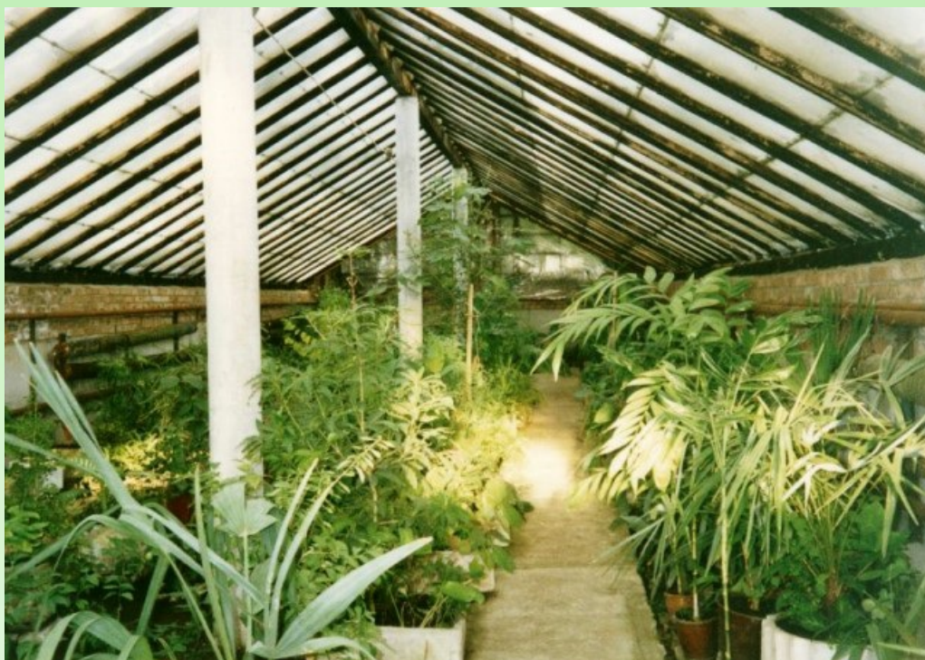
Рис. 6. Четвертая разводочная теплица, начало 2000-х годов.

Pic. 5. Greenhouse of the Botanical Garden of the Kuibyshev State University, late 90s.