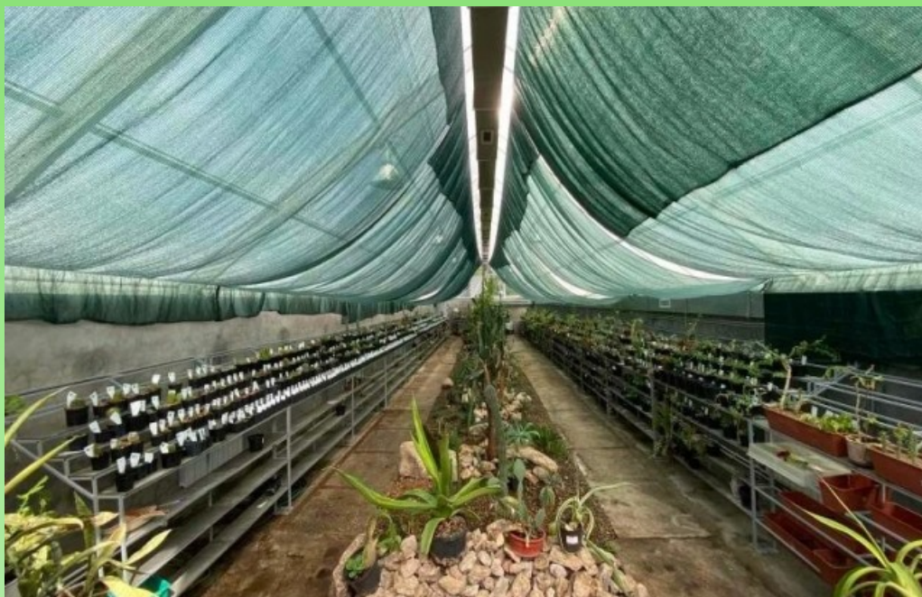
Рис. 12. Четвёртая разводочная теплица - экспозиция суккулентов, 2020 г.

Pic. 12. The fourth distribution greenhouse - exposition of succulents, 2020.