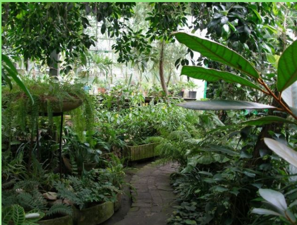
Рис. 8. Субтропический зал, 2007 г.