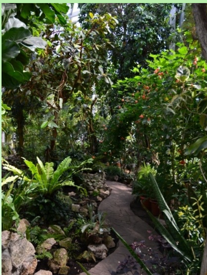
Рис. 13. Субтропический зал, 2019 г.

Pic. 12. The fourth distribution greenhouse - exposition of succulents, 2020.