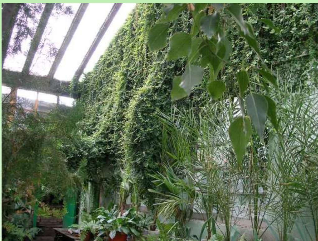
Рис. 9. Субтропический зал, 2007 г.