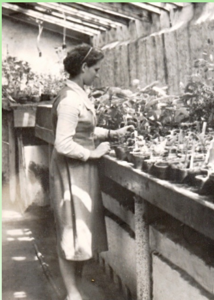
Рис. 3. Сотрудница оранжереи за осмотром сеянцев, 1961 г.