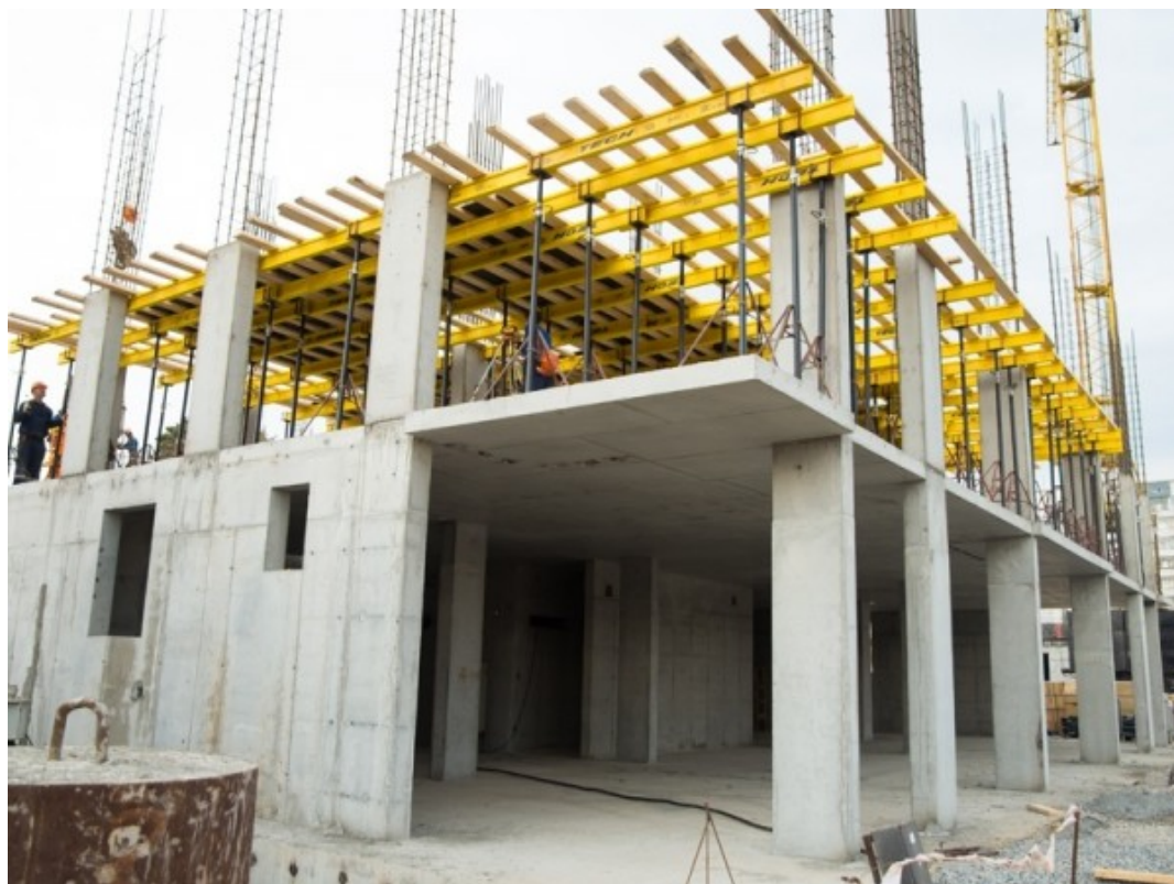
Рисунок 1 - Устройство опалубки перекрытий железобетонного дома