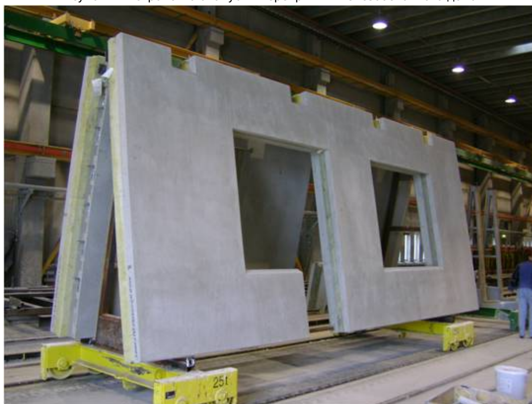
Рисунок 2 - Трехслойные железобетонные панели