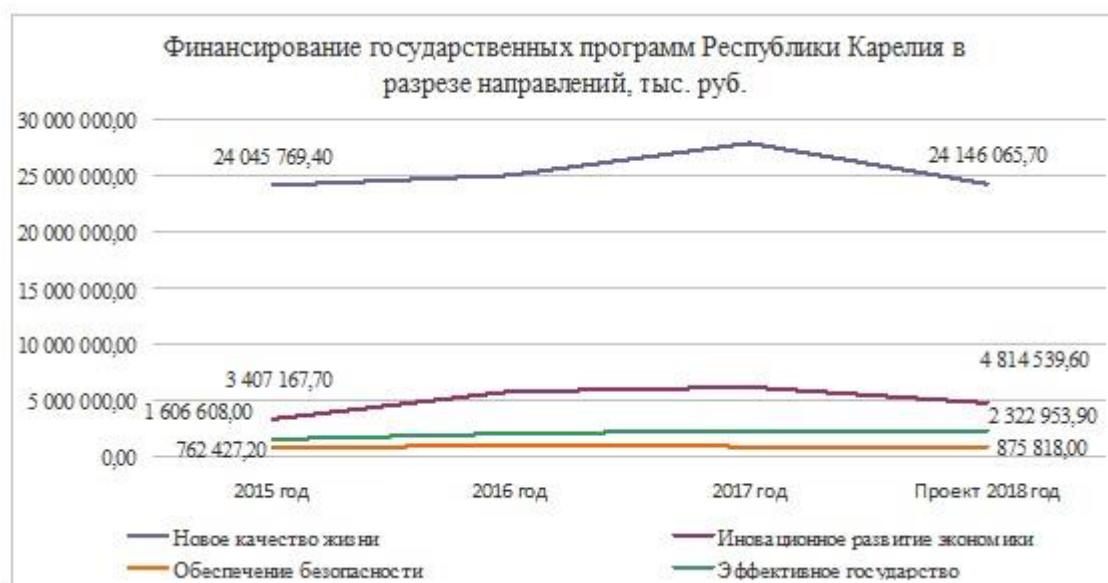
Рис. 1. Динамика финансирования государственных программ РК в разрезе направлений деятельности, тыс. руб.

Итак, по диаграмме видно, что в целом в 2017 году по сравнению с 2015 годом объем финансирования вырос по всем направлениям государственных программ. Объем бюджетных средств, выделенных на реализацию направления «Новое качество жизни», вырос на 15,5%. Финансирование направления «Иновационное развитие экономики» выросло на 82%. Это говорит о том, что Правительство Карелии взяло курс на поднятие экономики региона.