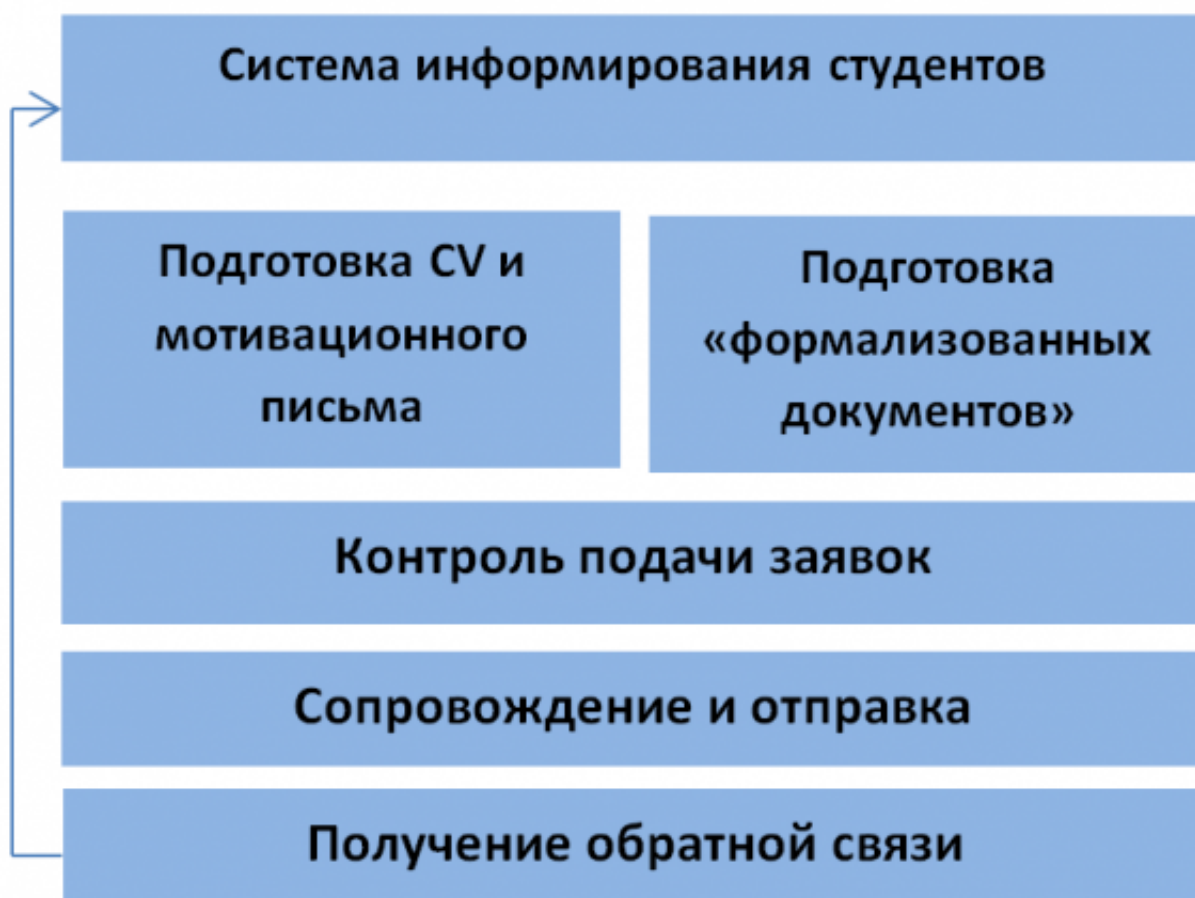
Рисунок 1. Комплексная система работы с участниками академической мобильности.

Programme а также Stipendium Hungaricum, Barents + , First, Erasmus Mundus ECW и др.