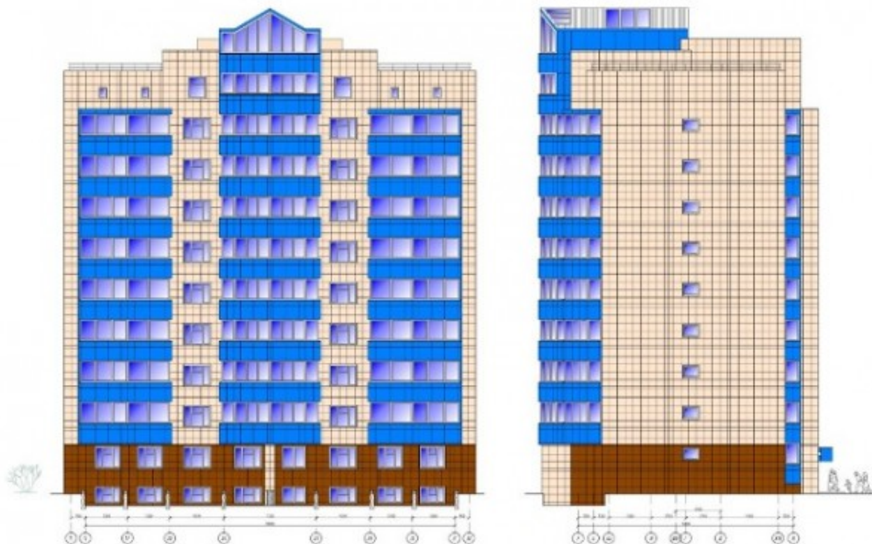
Рисунок 1[3]- Железобетонное строительство с вентилируемым фасадом

Строительство многоквартирного жилого дома на сегодняшний день является главным вариантом решения проблемы для застройщиков. Преимуществом технологии является заселение в дом нескольких семей, если возведение здания ведется на небольшом участке земли. Наружная отделка жилого дома должна обеспечить привлекательность фасада, а так же дополнительное утепление. Исключением из правил не были фасады многоквартирных домов. На рисунках 1,2,3 представлены рассматриваемые дома, которые имеют различный внешний вид.