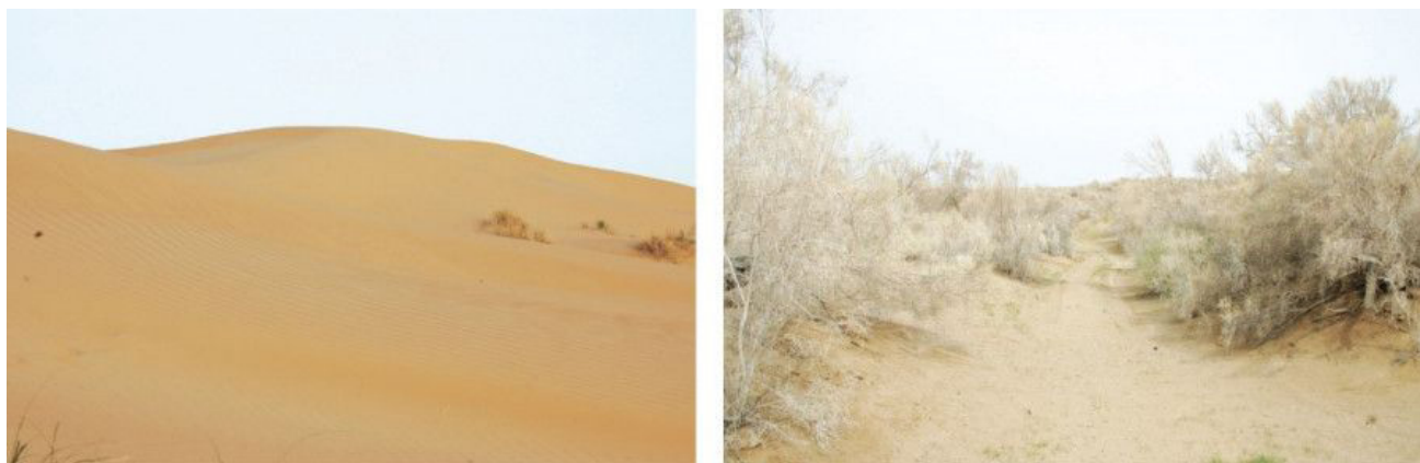
Рис. 2. Подвижные пески (слева) и саксауловые леса (справа) Каракумов