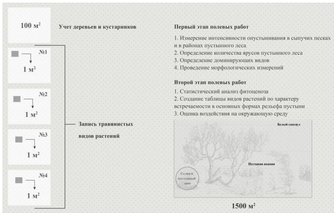
Рис. 4. Этапы проведения полевых работ