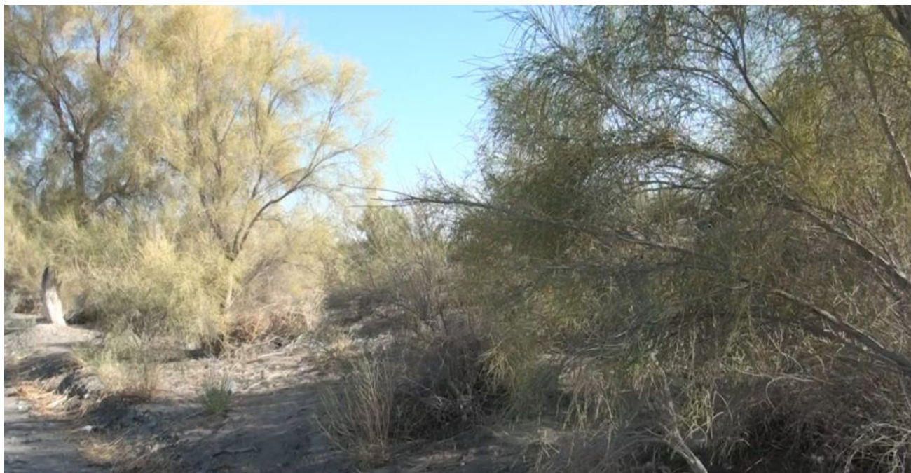
Рис. 5. Фитомелиоративные саксаульники

черного саксаула пригодны для производства уксусной кислоты и метилового спирта. Оба вида саксаула в зимнее время используются в качестве корма для верблюдов и овец. Широко применяется при закреплении подвижных песков. Во время наблюдений в Юго-Восточной части Каракумов мы увидели множество фитомелиоративных саксаульников (рис. 5).