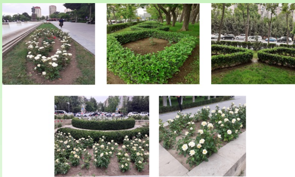
Рис. 2. Геометрические формы экспозиций в регулярном стиле.

В парке вокруг памятника Самеда Вургун создана красивая, круглая форма из цветущих красных и белых роз. В центральной части парка имеются фонтаны прямоугольной и круглой формы. Фонтаны красиво смотрятся и в жаркие летние дни создают прохладу в парке. Вокруг фонтанов цветут травянистые растения – ирисы, маргаритки, примулы. Розовые, белые, красные розы цветут в различных формах композиций и придают парку ещё большую красоту. Малые архитектурные формы – фонтаны, фонари, скамьи создают удобные условия для отдыхающих здесь людей.