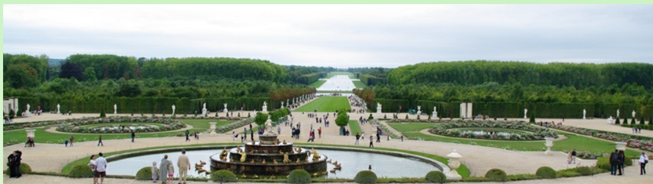
Рис.3. Вид со стороны Короля.

Сир, Вы могли бы увидеть картину этой битвы, находясь на безопасном расстоянии, с верхней террасы перед дворцом. По окончании битвы можно включить фонтаны для того, чтобы смыть кровь с травы и дорожек Версаля.