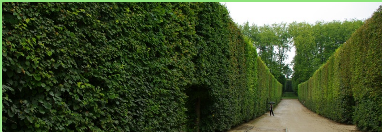
Рис.2. Тихие аллеи Версаля.