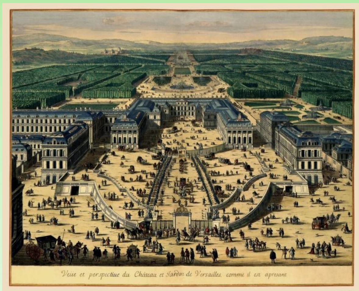
Рис.1. Старая карта Франции - Панорама Версальского дворца - 1683 г.