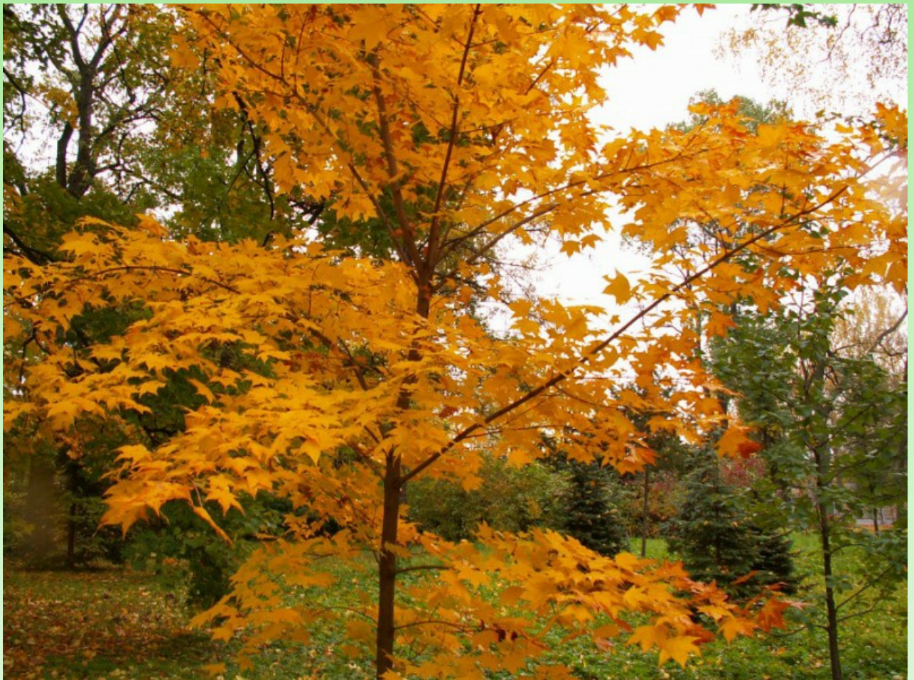
Рис. 3. Acer mono Maxim. f. mono в парке БИН РАН осенью.

7) На участке 94: растение из экспедиции Сада в Приморский край в сентябре 1997 г., Надеждинский район, р. Нежинка, ~350 м н.у.м., горная тайга (недалеко от китайской границы), посадка 2005 г. Только этот экземпляр имеет яркую пурпурно-красную окраску осенью (так повторяется каждый год), все остальные жёлтые (Рис. 3).