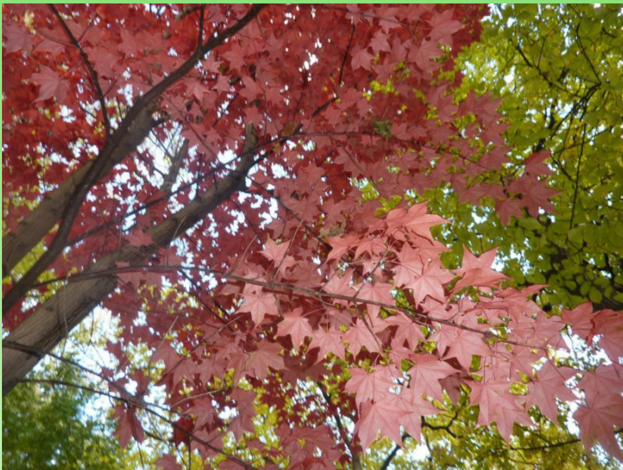
Рис. 8. Acer mono Maxim. f. purpureum Byalt & Firsov в парке БИН РАН на уч. 94 осенью (снимок со вспышкой).

Pic. 8. Acer mono Maxim. f. purpureum in the park of BIN RAS on the plot 94 in autumn (photo with flash).