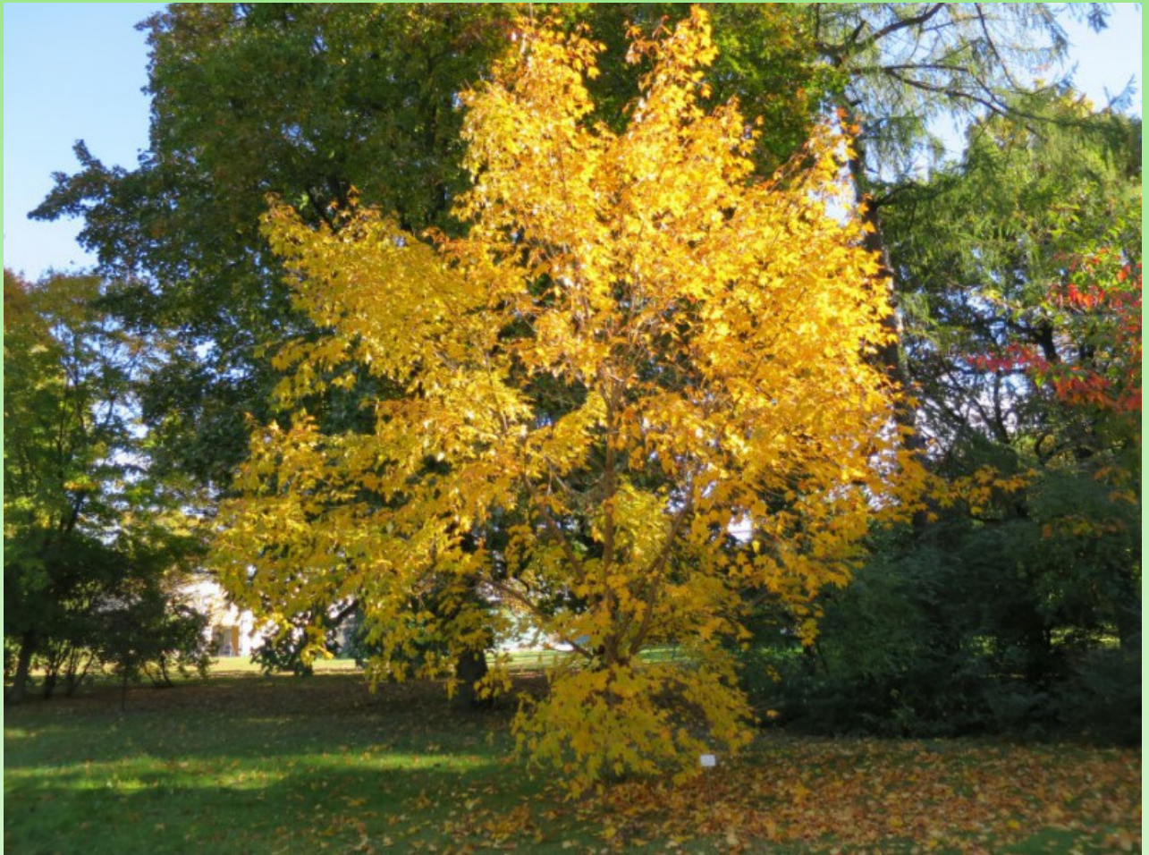
Рис. 2. Acer mono Maxim. f. mono в парке БИН РАН на уч. 145 осенью.

отличается высокими физико-механическими свойствами, мало коробится, стоит наравне с древесиной клёна остролистного, используется для изготовления фанеры и мебели. Морозобойные трещины встречаются редко. Хороший медонос. Красивое парковое дерево, устойчивое к болезням и вредителям, заслуживает более широкого распространения в наших парках. В городских насаждениях Санкт-Петербурга почти не встречается. Например, в городе растёт "Дерево Арескина", экземпляр клёна мелколистного из природы российского Дальнего Востока, которое было посажено Г. А. Фирсовым и Н. В. Лаврентьевым вместе с местными жителями Петроградского района во дворе дома на Съезжинской улице 15 мая 2010 г. в память о Роберте Карловиче Арескине, основателе Ботанического сада Петра Великого.