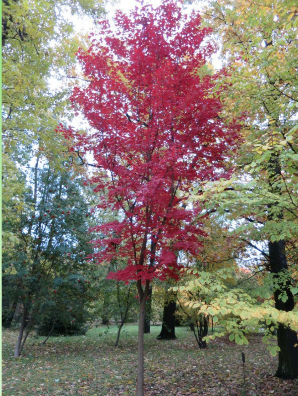
Рис. 5. Acer mono Maxim. f. purpureum Byalt & Firsov в парке БИН РАН на уч. 94 осенью.

как Acer platanoides 'Royal Red' и, в отличие от них, устойчиво к мучнистой росе листьев. Сезонная динамика развития синхронизирована с динамикой времён года на Северо-Западе России, каждый год дерево успевает закончить вегетацию и подготовиться к зимовке. Случаи обмерзания отсутствуют. Весной и летом окраска листьев обычная зелёная, как у других деревьев этого вида.