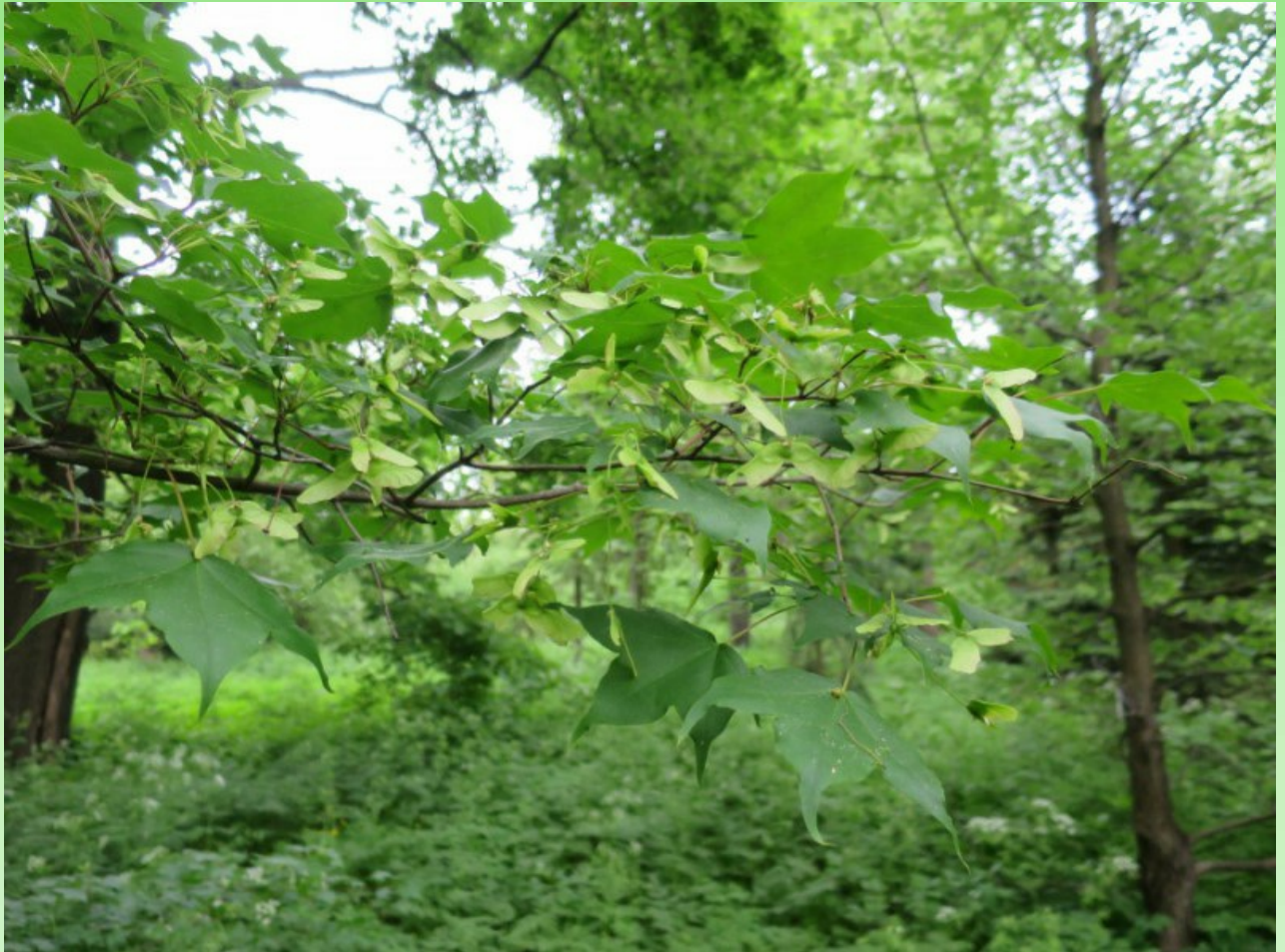
Рис. 1. Мелколистный клён ( Acer mono Maxim.) в парке БИН РАН летом.

В Саду выращивался с перерывами, начиная с 1861 г.: 1861-1870, 1889-1939, 1954 - по настоящее время (Связева, 2005). Введён в культуру Ботаническим садом БИН (Липский, Мейсснер, 1913-1915; Рис. 1).