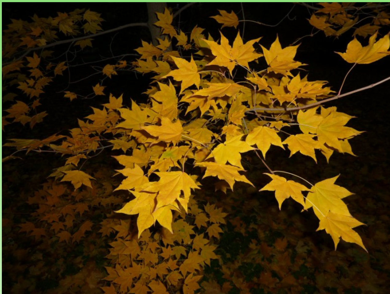
Рис. 4. Acer mono Maxim. f. mono в парке БИН РАН осенью (фото со вспышкой).