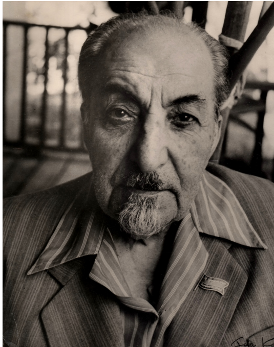
Илл. 2. Аветик Исаакян 7

запись: «Я знала, что он (Исаакян. — О. С.) любит Достоевского, но что он не любит Шекспира — этого я не знала» (см.: [Հովհաննիսյան=Ованесян, 1992: 62]). О Шекспире Исаакян сказал: «Шекспир, Шекспир, ну что он из себя представляет, это выдуманный писатель; что он вытворяет ради платка, — искусственные события, действия... Достоевский велик, он — Шекспир наших дней» (см.: [Հովհաննիսյան=Ованесян, 1992: 63]).