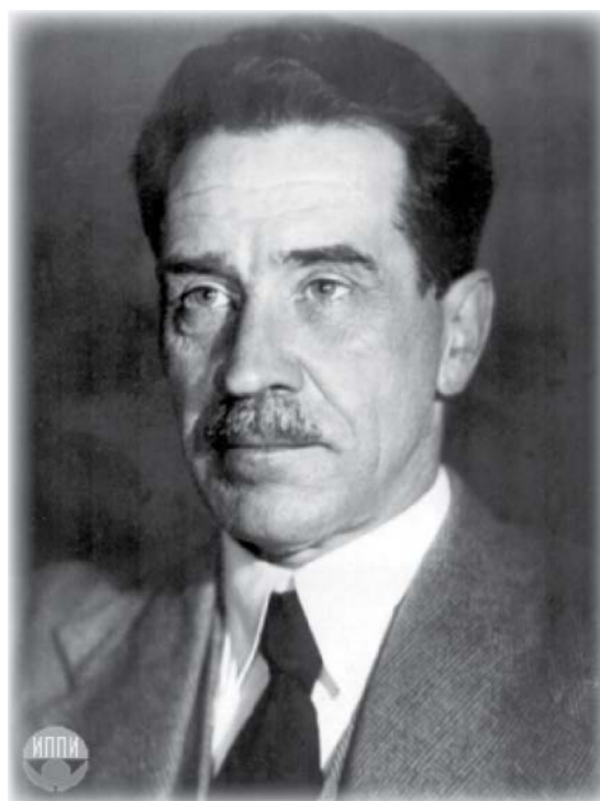
М. М. Карнаухова, учёный-металлург, профессор, академик АН СССР. Кавалер двух орденов Ленина, ордена Трудового Красного Знамени, ордена Красной звезды, Лауреат Сталинской премии.