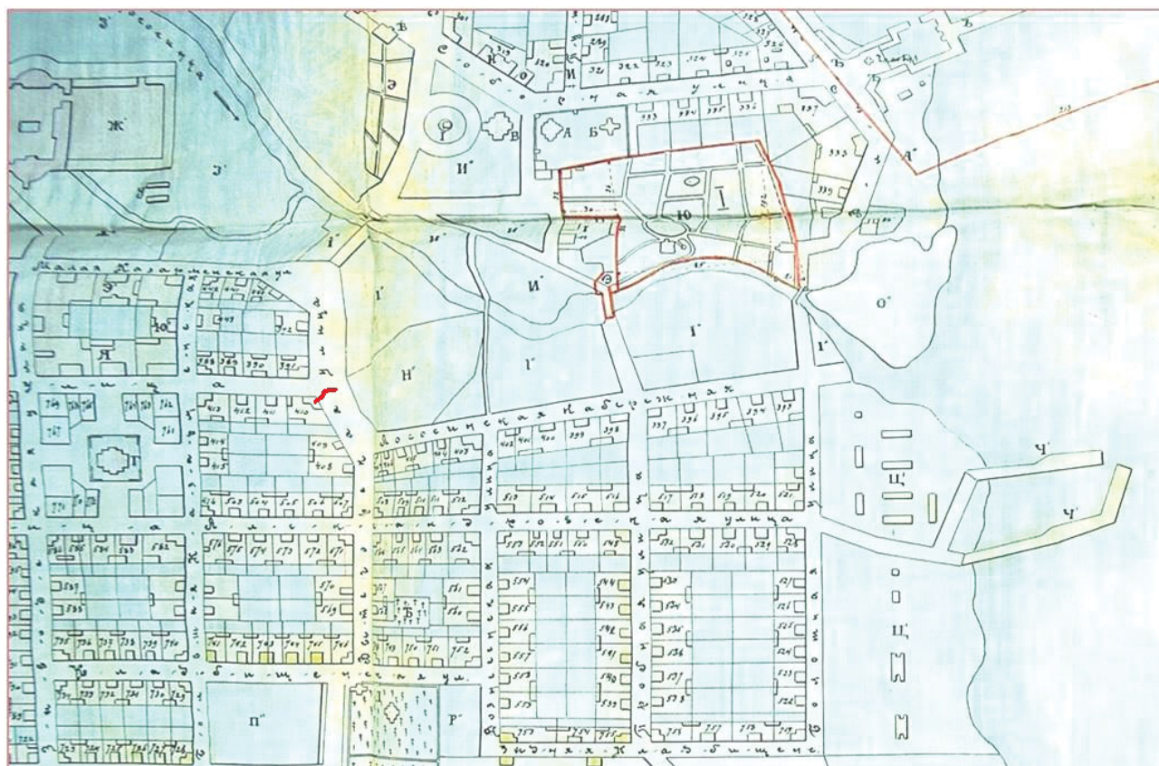
Дома Аврамовых на углу улиц Вытегорской и Большой Голиковской (ныне ул. Правды и Володарского). См. отметку красной стрелкой) на карте г. Петрозаводска 1854 г. (НА РК. Ф. 372. Оп. 1. Д. 7/150).