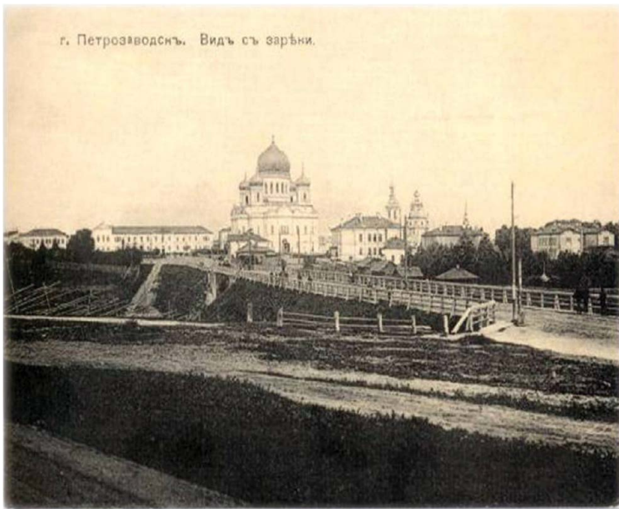
Вид с Зареки. В центре Аврамовский (бывший Трофимовский, с 1918 г. Советский мост). П. В. Аврамов занимался ремонтом и благоустройством Трофимовского моста. Открытка нач. XX в. Копия из архива Т. А. Мошиной

мов не только сотрудничал с М. Т. Трофимовым (они оба были гласными городской думы в 1871—1874 гг.), но и состоял с ним в родстве: вторым браком он был женат на племяннице Трофимова [20: 1—12об; 55: 102; 41: 31—32].