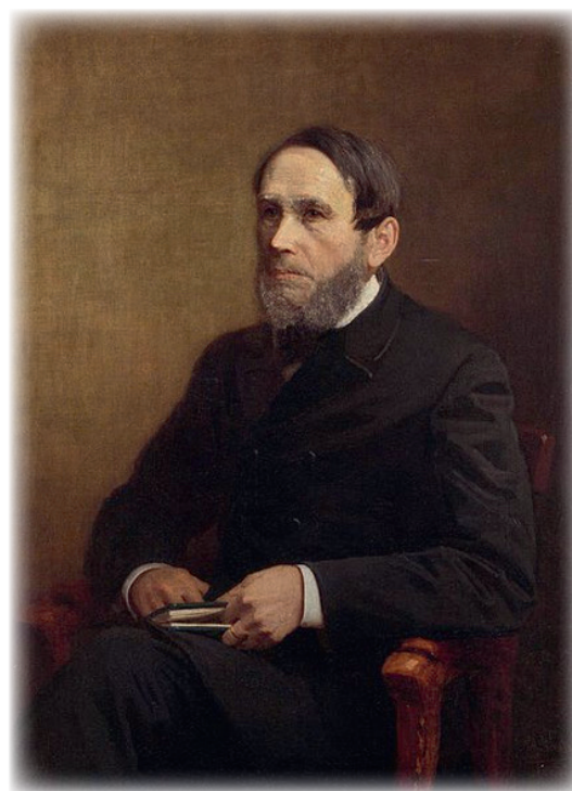
Рис. 1. Яков Карлович Грот (1812—1893), профессор Императорского Александровского университета, портрет кисти Йохана Кёлера 1899 г. [35]

Авторы-составители коллективного труда, опубликованного в 1910 г. под заглавием «Историческая записка о положении православия в Финляндской Карелии», рассмотрели историю православия в регионе с 1527 г. — начала «мучительного периода гонений за веру» — до 1710 г. — падения могущества