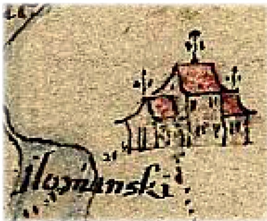
Изображение русской церкви на погосте в Иломанси (фрагмент карты Э. Уттера, 1649—1650 гг. [34])

Особое место в трудах историков занимает вопрос о сущности мер, предпринятых Россией в отношении православного населения шведско-карельского приграничья. Первостепенное внимание уделено оценке позиции московских патриархов и новгородских владык. Некоторые исследователи высоко оценивают роль новгородского митрополита Макария (1619—1626 гг.), принимавшего активные шаги для поддержания церковного общения православных карелов с Московской патриархией. Так, И. А. Чистович указывал, что в 1619 г. владыка обнародовал грамоту, в которой призывал карел к общению с Православной церковью и разрешил православному духовенству Кексгольмского лена ходить за исправлением церковных нужд к новгородскому митрополиту [27: 68]. Кроме того, в 1622 г. по ходатайству жителей Иломанского погоста с благословения патриарха Филарета и повеления Михаила Федоровича Романова (1613—1645 гг.) митрополиту Макарию (1619—1626 гг.) было разрешено давать благословение приходским общинам Кексгольмского лена на возведение новых церквей на месте разрушенных или обветшавших храмов, а также посылать людей испытанной веры и жизни — священников и дьяконов, привозивших с собой русские богослужебные книги [27: 68] (рис. 5).