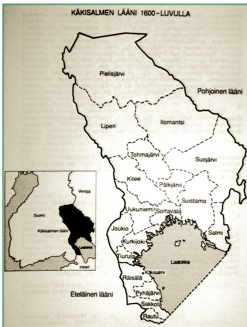
Рис. 3. Кексгольмский лен в XVII веке [35: 758]

На современном этапе ученые обратились к изучению истории локальных сообществ и поставили вопрос о том, как характер взаимоотношений России и Швеции повлиял на состояние религиозной жизни в крае. В частности, посвятив исследование истории деревни Импилахти ( Impilahti ) в XIV — начале XX века, финляндский исследователь П. Копонен ( P. Koponen ) (1982 г.) кратко описал, как здесь развивалась церковная жизнь в XVII веке [29: 35]. Привлекая материалы шведских земельных регистров, Х. Киркинен ( H. Kirkinen ) (1998 г.) подсчитал количество православных церквей в Кексгольмском лене и оценил политику шведских властей в отношении карельского приграничья после 1617 г. [9]. Шведский исследователь М. Мёрнер в статье, опубликованной в 2007 г., выявил особенности управления Швецией завоеванными в 1617 г. округами (графствами) Кексгольма и Ингрии [13] (рис. 3). В 2015 г. финляндский историк А. Куяла выяснил, какое место занимал религиозный фактор во взаимоотношениях шведского правительства и подданных Кексгольмского лена [12].