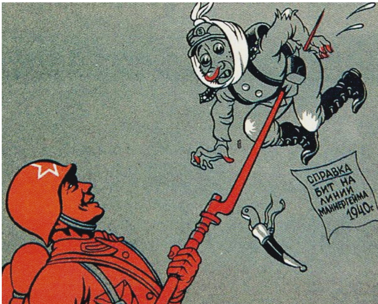
Встреча на Кексгольмском направлении. Старые знакомые. Плакат работы Кукрыниксов.