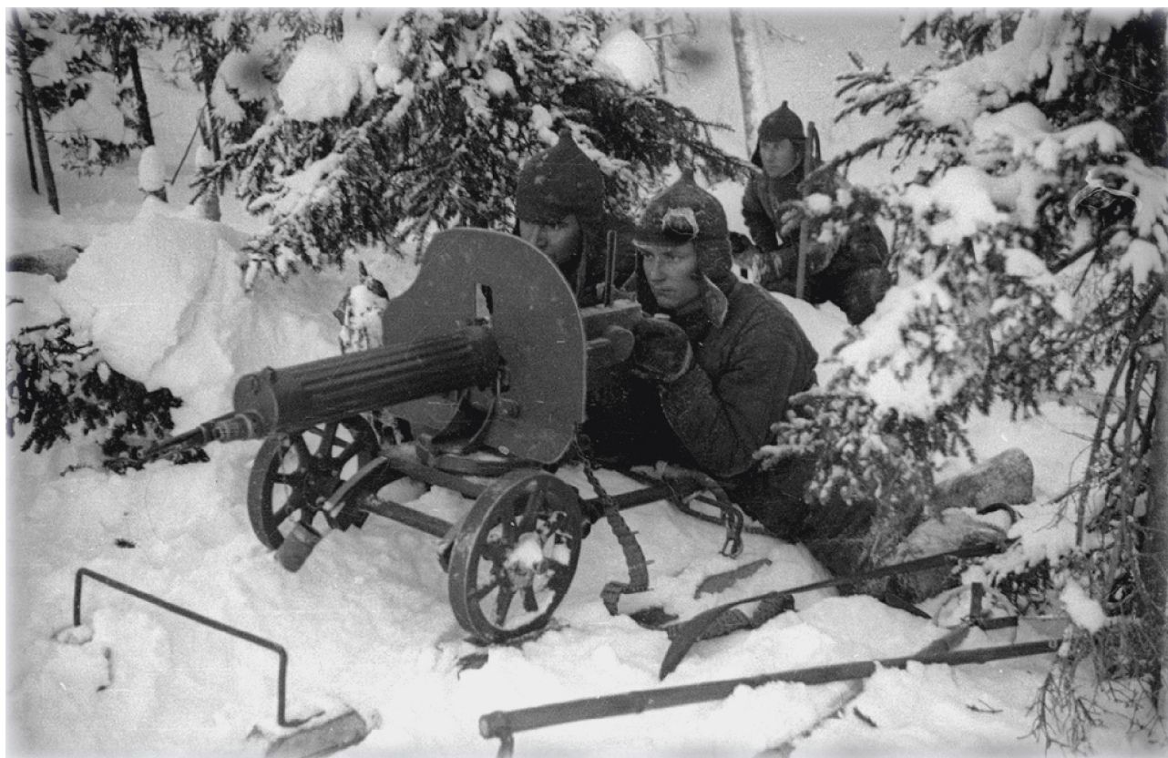
Зимняя война. Пулеметчики на передовой позиции.

В очевидном противопоставлении «финской военщине» присутствует образ Красной Армии. Она представлена как «богатырская сила», как «армия-освободительница» [6: 1], которая