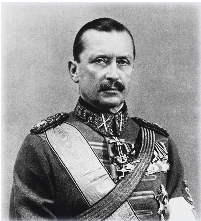
Карл Густав Эмиль Маннергейм