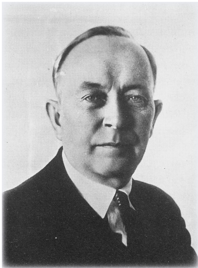
Отто Вильгельмович Куусинен

и «верного сына финского народа» Отто Куусинена. Именно Народное правительство, с точки зрения советского руководства, являлось прочной опорой в обретении финским народом независимости от белофинского руководства, являвшегося орудием иностранного капитала. Советскому Союзу отводилась роль «великого друга финляндского народа» [16: 1], который помогает ему обрести независимость.