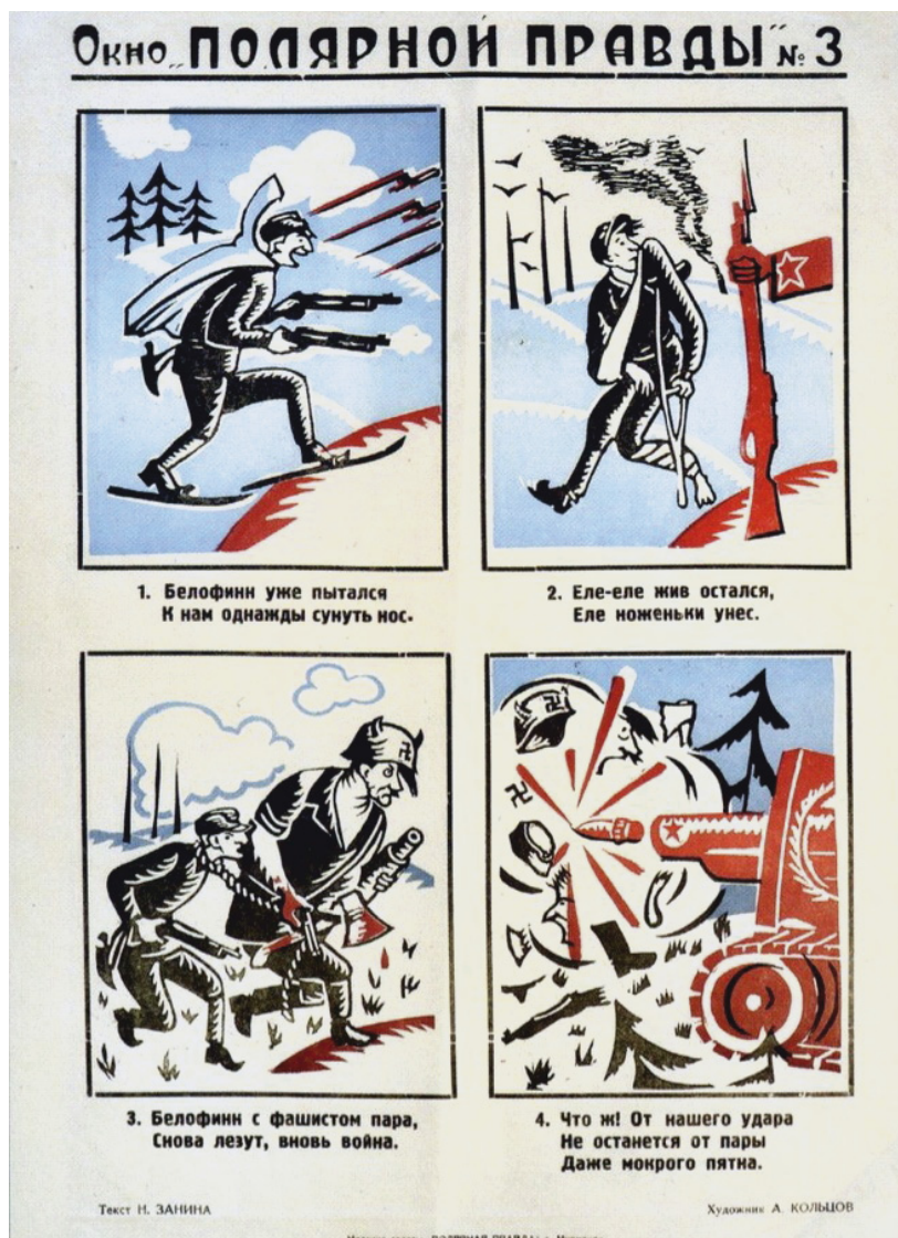
Сатирические плакаты мурманской областной газеты «Полярная правда». Художник А. Кольцов. Текст Н. Занина. URL: http://kolanord.ru/html_public/col_war/Okna-Polyar-pravdy_katalog_2014/10/

Народу Финляндии противопоставлялось его правительство, равно как и буржуазия. Много внимания уделено представлению финляндского руководства в прессе в 1939 г. в негативном ключе, что достигалось с помощью подбора соответствующих словосочетаний. Так, когда речь заходила о реваншистских устремлениях в реализации плана воссоздания «великой