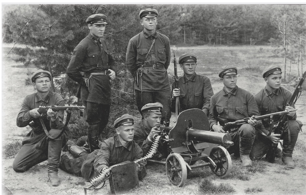
Красноармейцы и командиры ГУПВО ОГПУ (НКВД). 1-я пол. 30-х гг.

В крупномасштабном планировании трансграничных операций представители советской власти нередко недооценивали влияние сурового климата и проблематичной местности. Например, проведение репатриации карельских беженцев в ходе амнистии 1923 г., позволившей им вернуться в Советский Союз из Финляндии, в значительной степени игнорировало местные условия в пользу советских стратегических соображений. Вместо реализации первоначальных планов организации перемещения беженцев через Белоостровский пограничный пункт и таможни на Карельском перешейке, было решено использовать северокарельские пограничные маршруты, которые находились ближе к прежним местам проживания бежен-