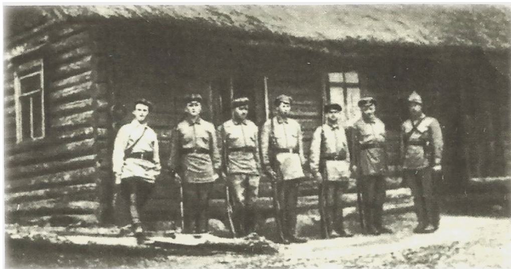
Одна из первых пограничных застав.

советско-финляндской границы включала лишь девять таможенных застав, штат которых не превышал двух-четырёх таможенников, а также таможню в Петрозаводске [15: 97].