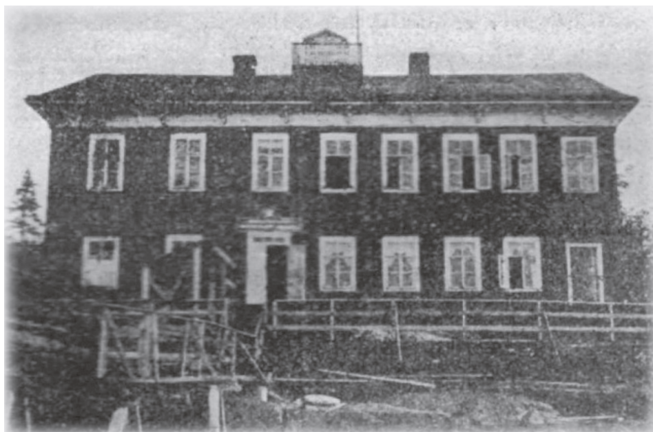
Здание Ковдинской таможенной заставы в 1911 г. Илл. из книги К. М. Агамирзоева. Одиссея надворного советника Дьяконова

«местная полиция почти никаких мер не принимает к задержанию и считает это дело второстепенным и как бы не входящим в ее обязанности, да и что может поделать один какой-либо урядник в Кореле, где вся Корела пользуется контрабандой из Финляндии». [4: 2—4].