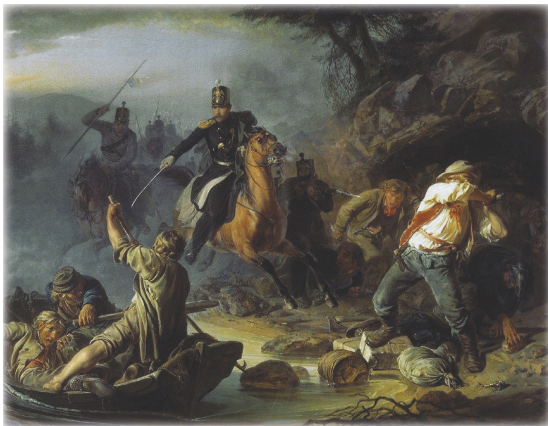
Стычка с финляндскими контрабандистами. (Худ. Худяков Василий Григорьевич, 1826—1871)

источники, вплоть до конца 1920-х гг. подобные поселения оставались крупнейшими «контрабандными транзитными пунктами» [8: 4].