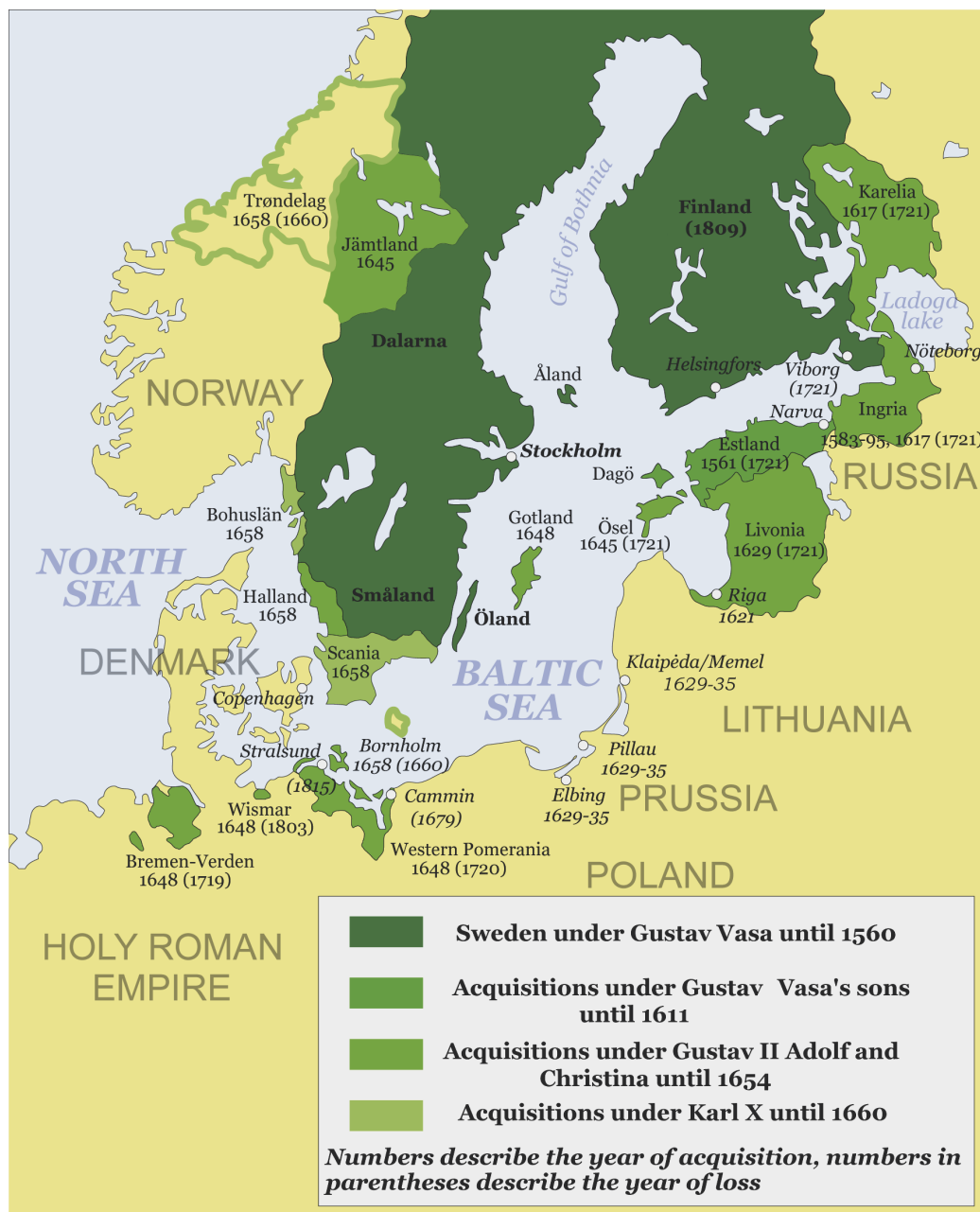
Шведская империя (1560—1815) ( https://en.wikipedia.org/wiki/File:Swedish_Empire_(1560-1815)_en2.png )

ниями шведской короны, но им не был дарован статус провинций. Власть здесь принадлежала генерал-губернатору, подчинявшемуся напрямую королю. Однако вскоре шведам пришлось возвратить эти земли России по Тявзинскому миру 1595 г.