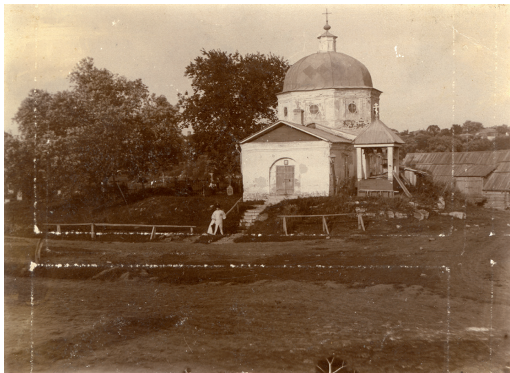
Илл. 5. Вид Входа-Иерусалимской церкви в городе Зарайске (Неизвестный фотограф. Желатиновый отпечаток. 1900-е гг.)