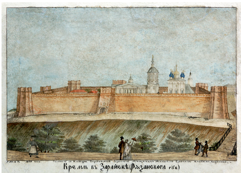
Илл. 2. Кремль в Зарайске (Бровкин М. С. Бумага, акварель. 1859 г. Государственный музей-заповедник «Зарайский кремль»)

Fig. 2. The Kremlin in Zaraysk Town (by Brovkin M. S. Paper, watercolor. 1859. The Zaraysk Kremlin State Museum-Reserve)