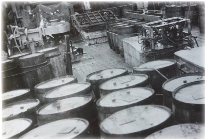
«Затарились». Фотография из архива колхоза «Беломор».