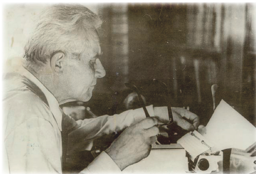
Рис. 1. Писатель Антти Тимонен за работой 2

В начале XX века Карелия 1 представляла собой нестабильный регион в административном, политическом, военном и социальном отношениях. Первая мировая война и последовавшая за ней революция 1917 г., в одночасье превратившие Карелию в государственный форпост; интервенция и Гражданская война, — все эти события раздирали край и, в первую очередь, отражались на местном населении, которое зачастую не понимало, что происходит. Очень точно передают атмосферу ужаса и неразберихи, которая обрушилась на карельских крестьян, слова известного писателя Антти Тимонена, уроженца деревни Луусалми (ныне в Калевальском районе), который ребёнком стал свидетелем этих трагических событий: «Мне больше помнятся рыдания женщин по расстрелянным мужьям, убийства, пожары, отчаянные крики о помощи. В том, что происходило, я, конечно, ничего не понимал, как не понимали этого и многие взрослые. Поди-ка тут разберись, если уходят и приходят то белые, то красные финны, то белые, то красные карелы, то белые, то красные русские! Если появляются карелы в английских мундирах и с английским оружием и преследуют сегодня белофиннов, а завтра русских белогвардейцев... Еще и через столетия в этом нелегко было разобраться, и даже теперь не все ясно самим историкам» [6: 9].