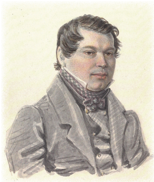
М. М. Нарышкин