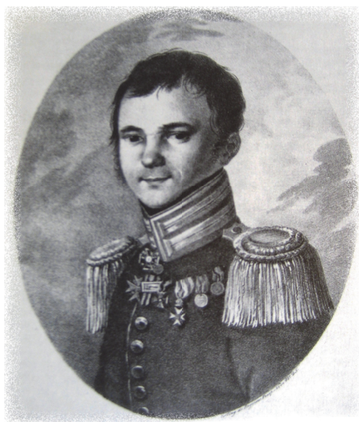
Ф. Н. Глинка

Эта тема близка мне, так как впервые в Петропавловской крепости я побывала ещё школьницей-пионеркой, а мои студенческие годы прошли в стенах здания Академии художеств, в одно из помещений третьего этажа которого с Сенатской площади во время восстания попало артиллерийское ядро [20: 190]. Долгое время мы с историком Николаем Александровичем Кораблевым собирали материалы для книги «Олонецкие губернаторы и генерал-губернаторы» [30], просмотрели немало архивных документов и книг по истории российского дворянства, мемуаров, и уже в начале 2000-х гг. выяснили, что среди родственников высокопоставленных чиновников губернии были декабристы. В 2006 г. мной было подготовлено небольшое сообщение для газеты «Лицей» [36: 11], но исследовательская работа продолжалась, и то, что удалось ещё найти, уточнить, дополнить, стало основой данной статьи.