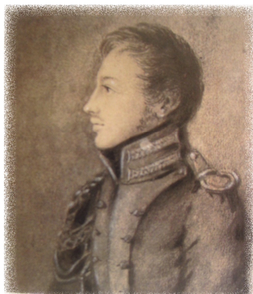
П. И. Пестель