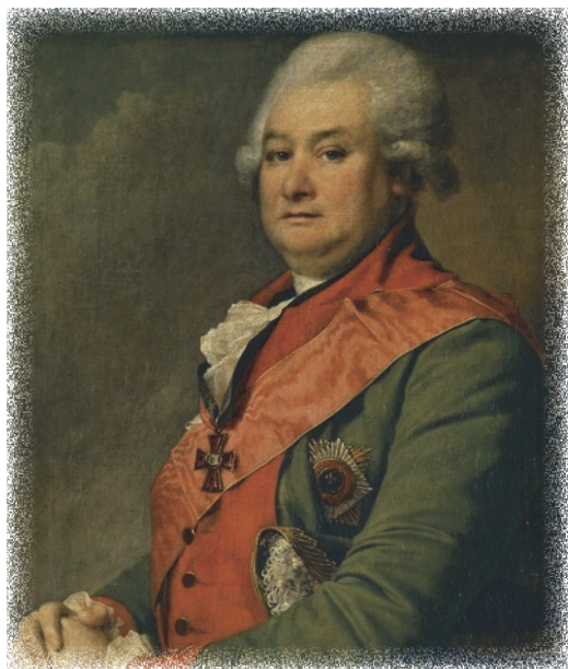
Губернатор П. П. Коновницын