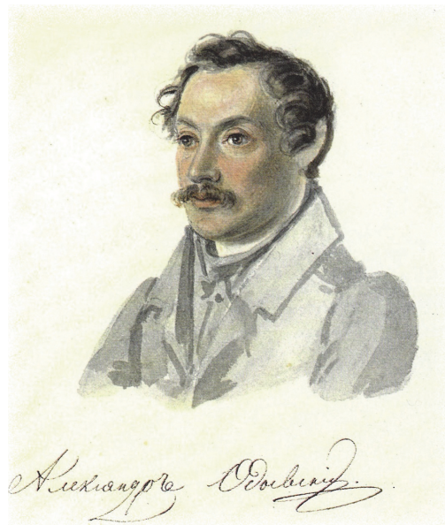
А. И. Одоевский