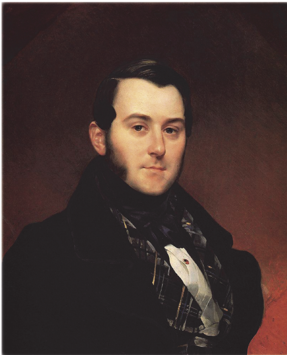
Портрет И. А. Бека кисти Карла Павловича Брюллова, 1836 г. [42]