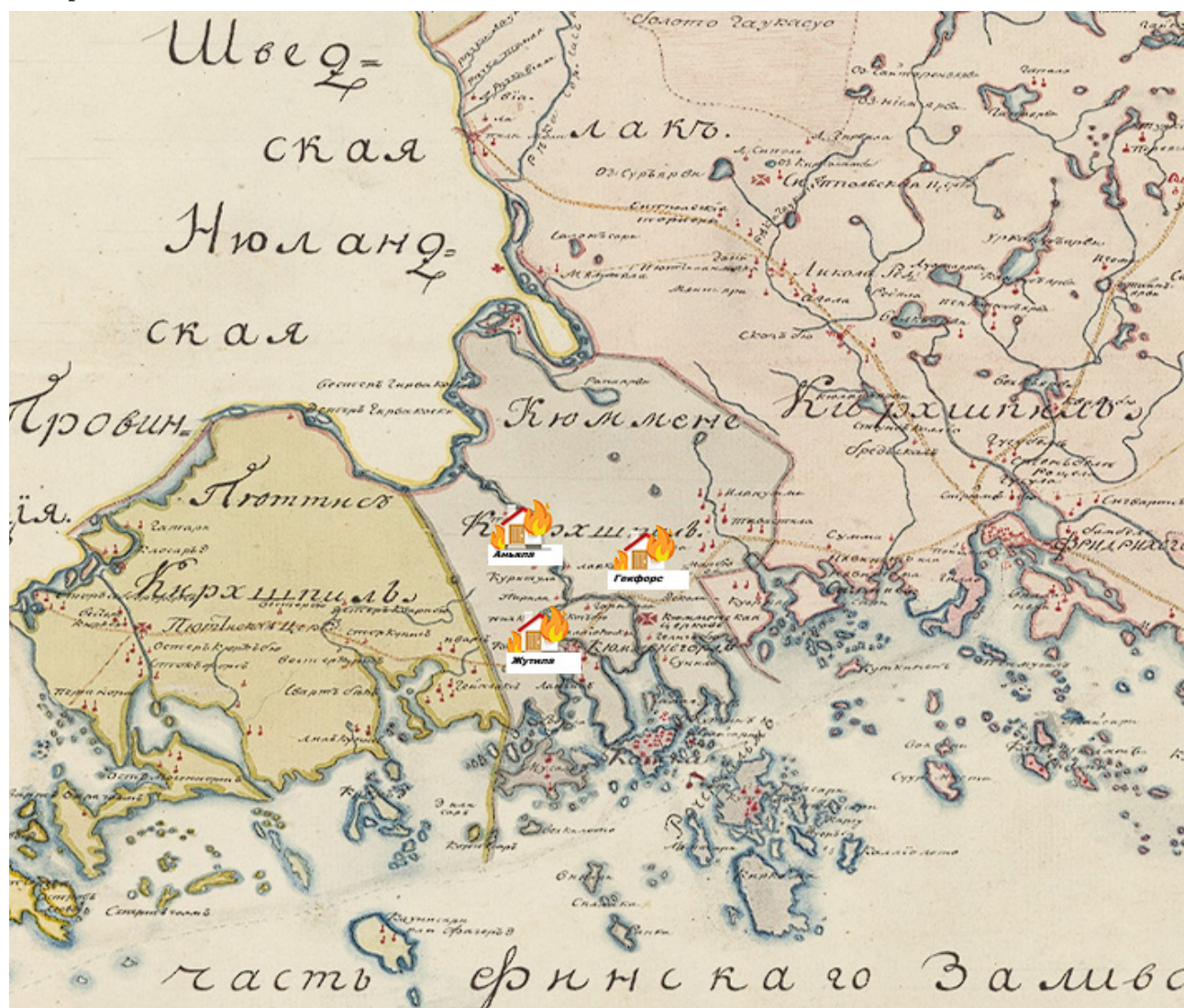
Поселения, наиболее сильно пострадавшие от пламени огня в русско-шведской войне 1788—1790 гг., нанесенные на фрагмент карты Кюменегорского уезда 1802 г. [15]

Не обошёл вниманием Степан Апраксин и состояние финских деревень, волею обстоятельств пострадавших от военных действий.