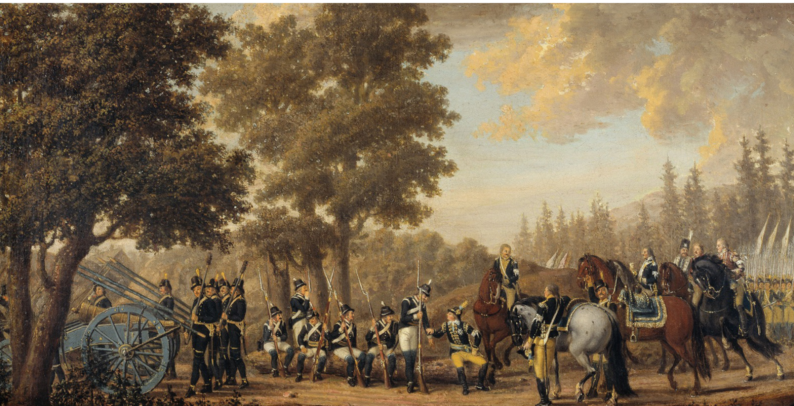
Pehr Hilleström. Густав III и солдат Грен. Эпизод из войны 1789 г. [12]

степени в военном противостоянии были задействованы территории шведской части Финляндии.