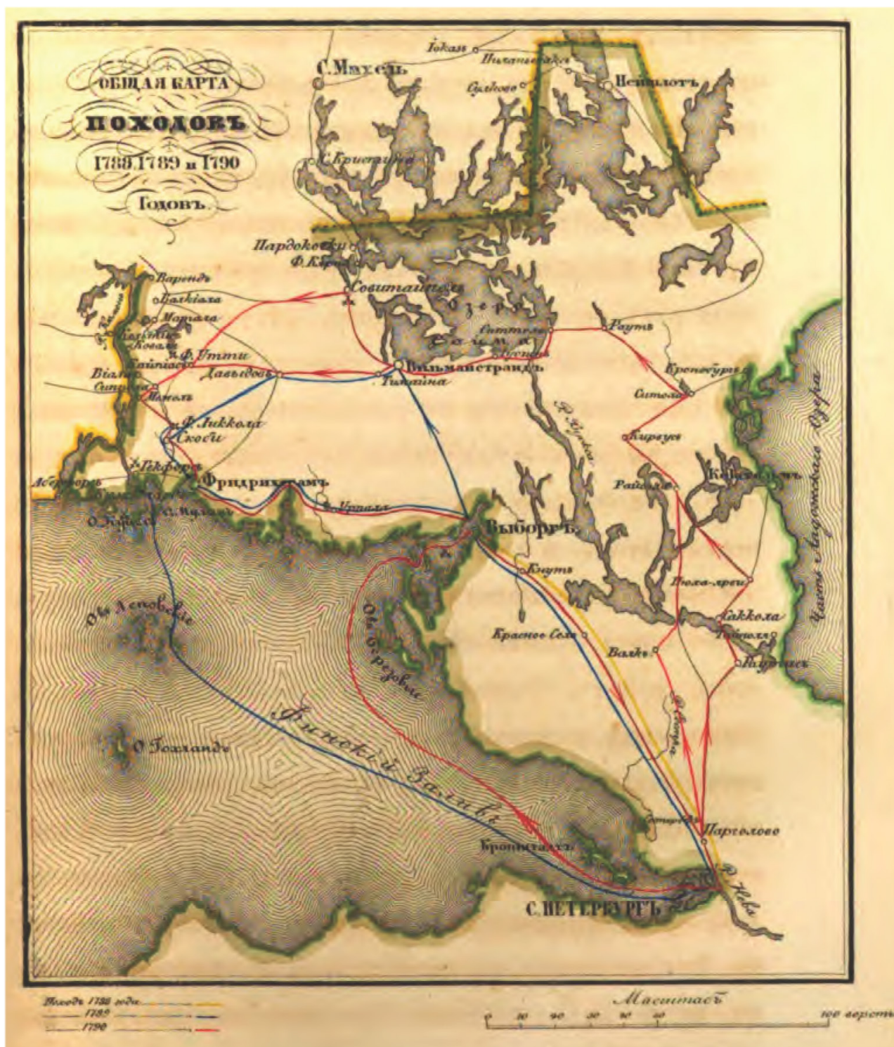
Общая карта походов 1788, 1789 и 1790 годов [11]

вклада в победу над шведами. В 1789 г. под командованием генерала Ивана Михельсона башкиры смогли оттеснить шведов до мыса Кристины [3: 23].