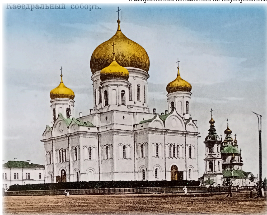
Святодуховский Кафедральный собор [38 : обл.]