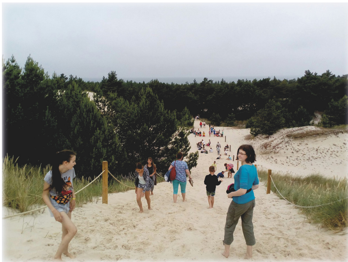
Песчаные «плавающие» дюны, а на горизонте — Балтийское море