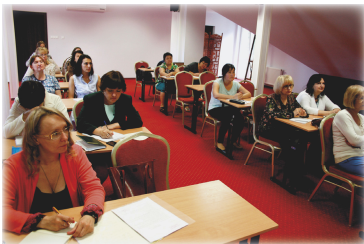
Слушатели Летней школы — 2017