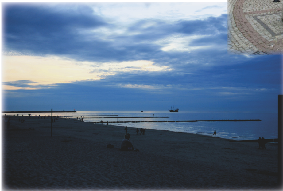
Город-курорт Устка, входящий в Поморское воеводство, расположен на побережье Балтийского моря