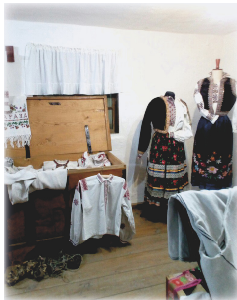
Традиционные костюмы кашубов