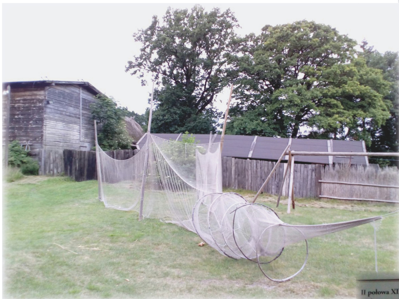
Польские рыбаки, как и карельские, использовали мерёжу — рыболовную снасть-ловушку (натянутую на обручи сетку)

Стенд, посвящённый русскому славяноведу А. Ф. Гильфердингу в этнографическом музее в местечке Клюки. А. Ф. Гильфердинг — автор работы о Кашубском Поморье, кашубах, словинцах и их языках: «Остатки славян на южном берегу Балтийского моря» (Санкт-Петербург, 1862). А. Ф. Гильфердинг известен в Карелии как собиратель русского фольклора: в 1871 г. в поездке по Олонецкой губернии он записал 318 былин