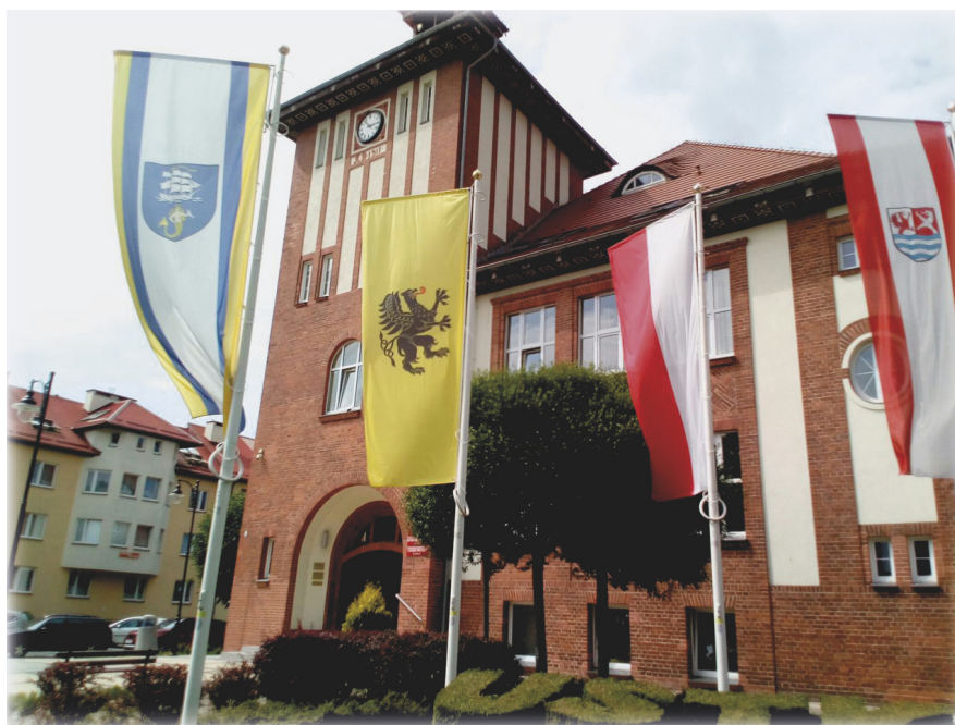
Город Устка, Польша

Курсы проходили в Ольштыне, Устке (Польша), Таранто (Италия), Топольчанки (Словакия). В следующем году планируются продолжить работу в болгарском городе Варна.