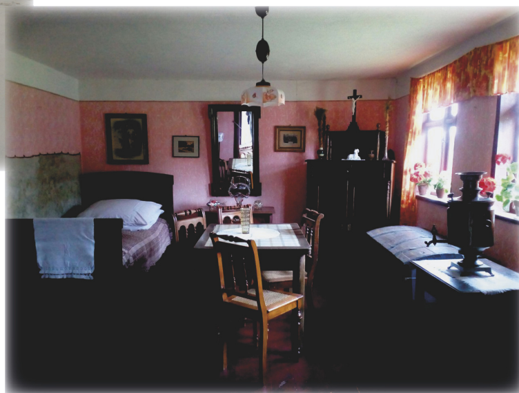
Этнографический музей «Словинская деревня» в местечке Клюки (Kluki)

В национальном парке сохранились памятники культуры. В этот же день слушатели курсов посетили этнографический музей «Словинская деревня» в местечке Клюки (Kluki), который демонстрирует сельский быт и своеобразную культуру словинцев.