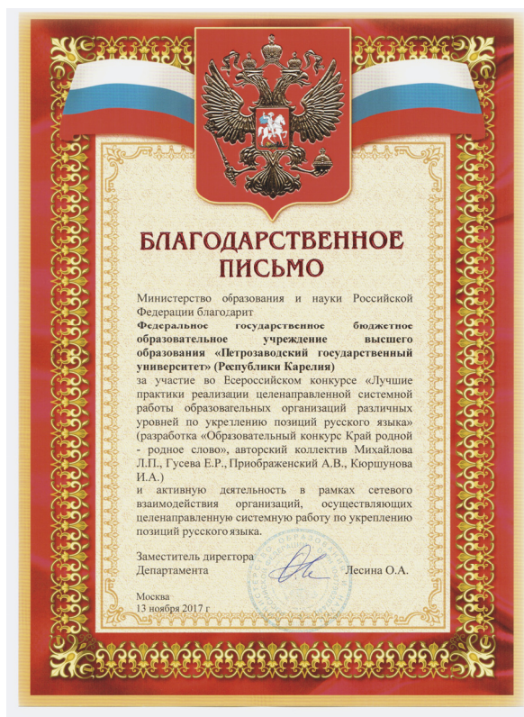
Благодарственное письмо Министерства образования и науки Российской Федерации