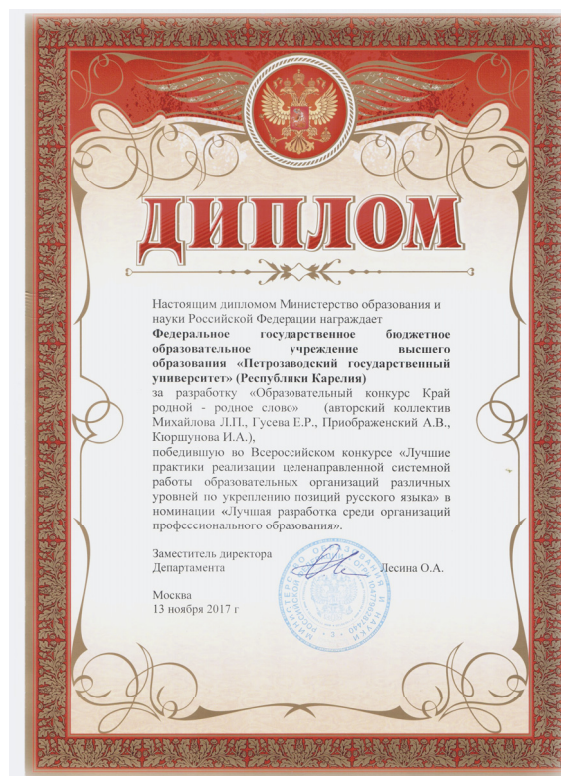
Диплом Министерства образования и науки Российской Федерации за разработку «Образовательный конкурс “Край родной - родное слово”»,

Петрозаводский государственный университет включен в Модуль сетевого взаимодействия организаций, осуществляющих целенаправленную системную работу по укреплению позиций русского языка 1 .