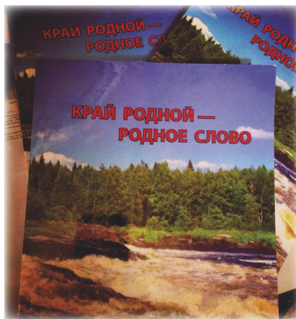
Учебное пособие Край родной — родное слово [2]