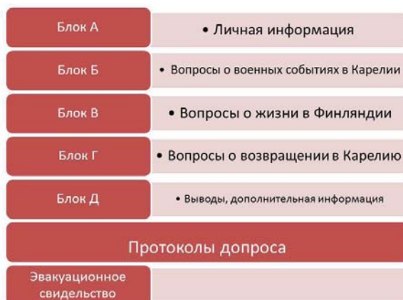
Структура карточки базы данных