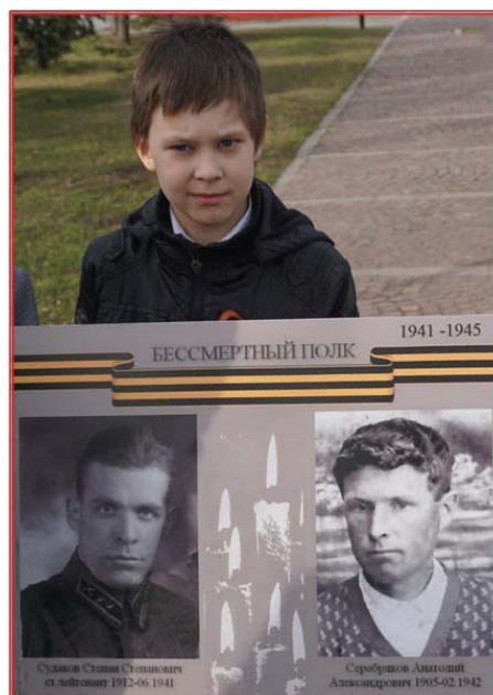
Вахта Памяти у «вечного огня» в Петрозаводске 07.05.2015.