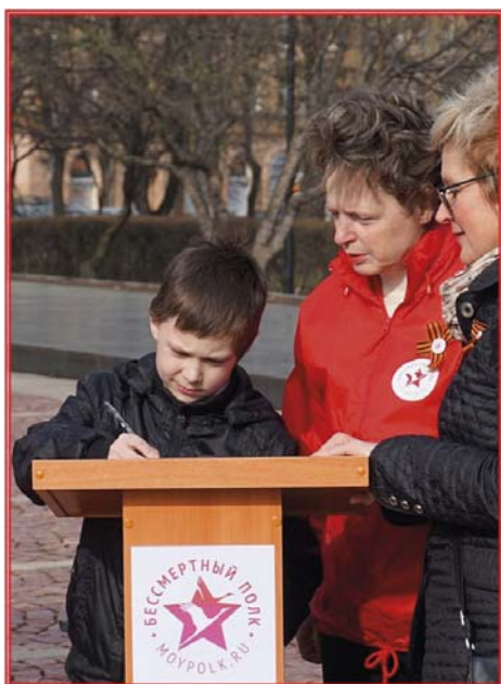
Вахта Памяти у «вечного огня» в Петрозаводске 07.05.2015.