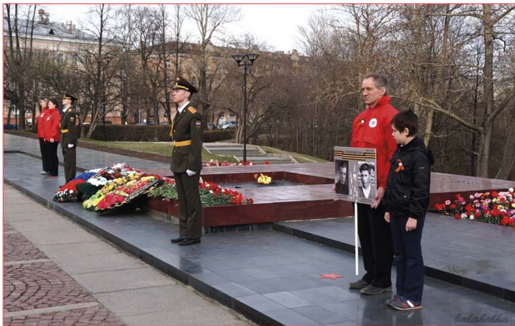
Вахта Памяти у «вечного огня» в Петрозаводске 07.05.2015.

Мы сами должны передать память обо всех наших близких, переживших ужасное лихолетье, своим детям и внукам. За нас этого никто не сделает. Я надеюсь, что ребятам, которые отстояли Вахту Памяти, никогда не придет в голову кататься на роликах по мемориалам или жарить картошку на «вечном огне».