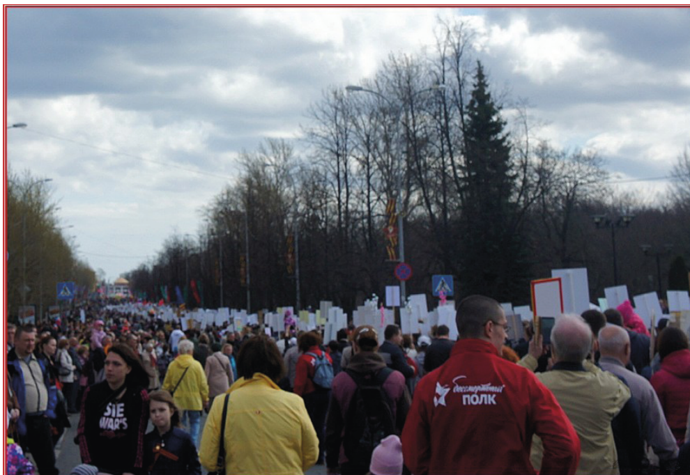
Колонна Бессмертного Полка в Петрозаводске на проспекте Карла Маркса 09.05.2015.

В рядах Бессмертного Полка на Параде 9 мая 2015 г., посвященном 70-летию победы в Великой Отечественной войне, по улицам и площадям Петрозаводска прошли более пяти тысяч человек.